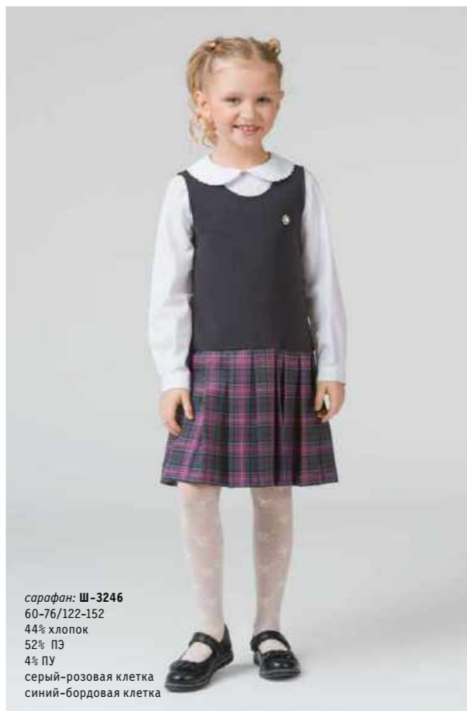
сарафан: Ш-3246 60-76/122-152 44% хлопок 52% ПЭ 4% ПУ серый-розовая клетка синий-бордовая клетка