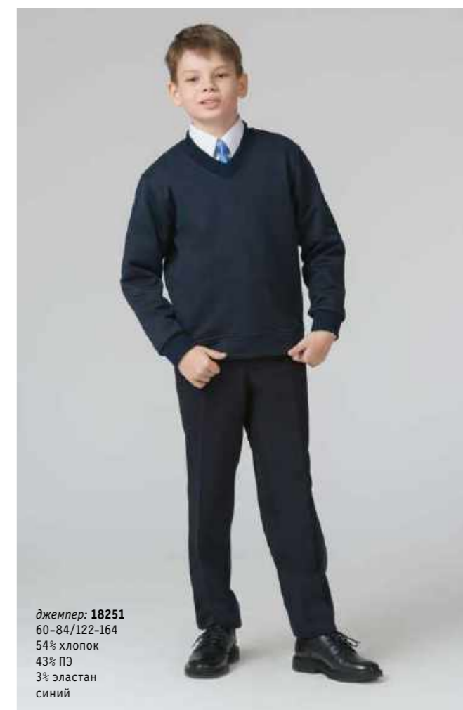
джерсер: 18251 60-84/122-164 54% хлопок 43% ПЭ 3% эластан синий