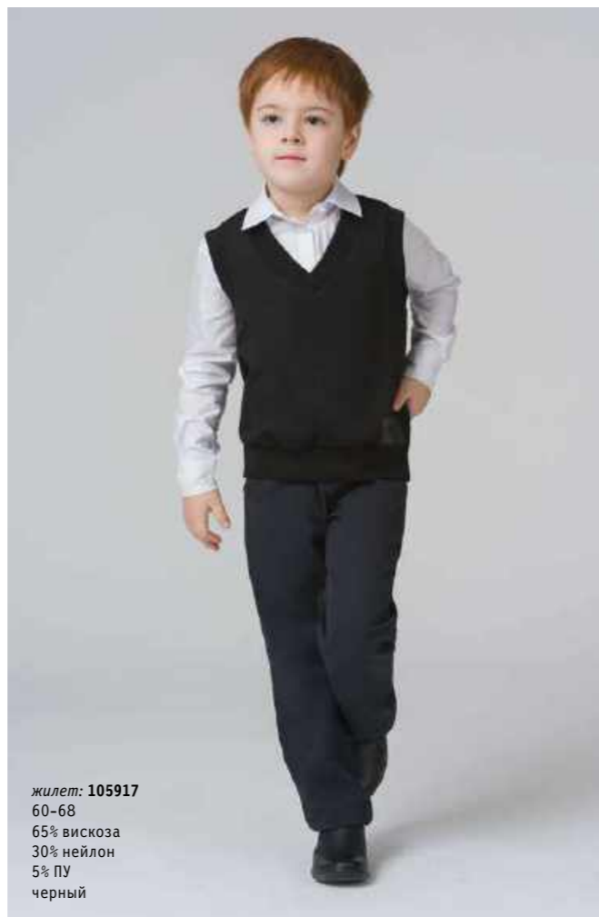
жилет: 105917 60-68 65% вискоза 30% нейлон 5% ПУ черный