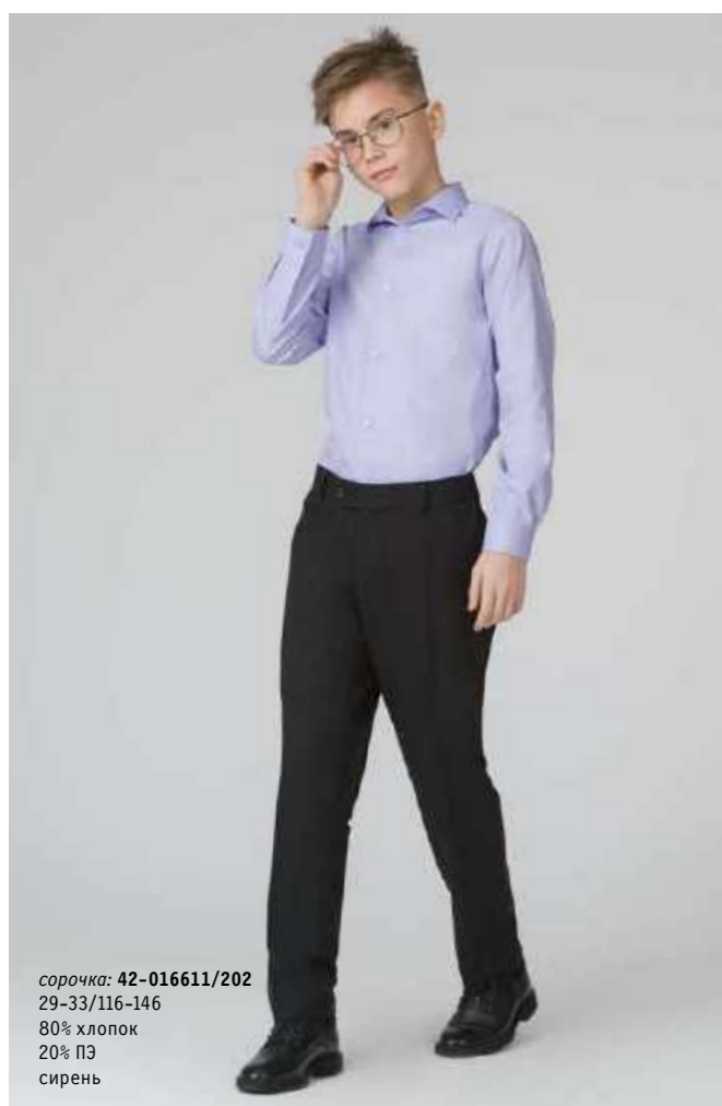
сорочка: 42-016611/202 29-33/116-146 80% хлопок 20% ПЭ сирень