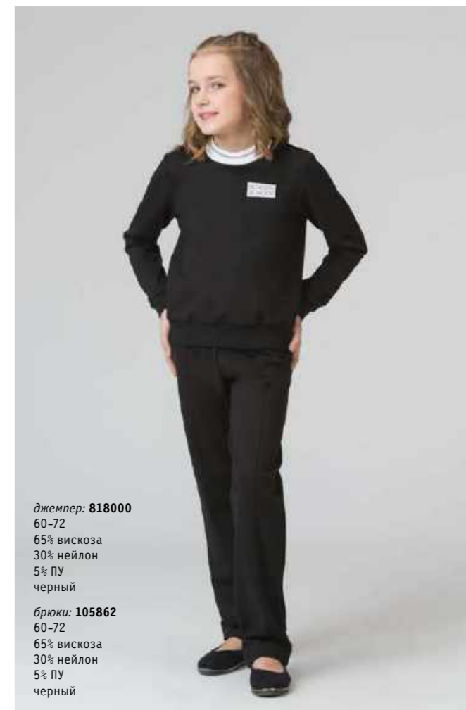
джерпер: 818000 60-72 65% вискоза 30% нейлон 5% ПУ черный брюки: 105862 60-72 65% вискоза 30% нейлон 5% ПУ черный