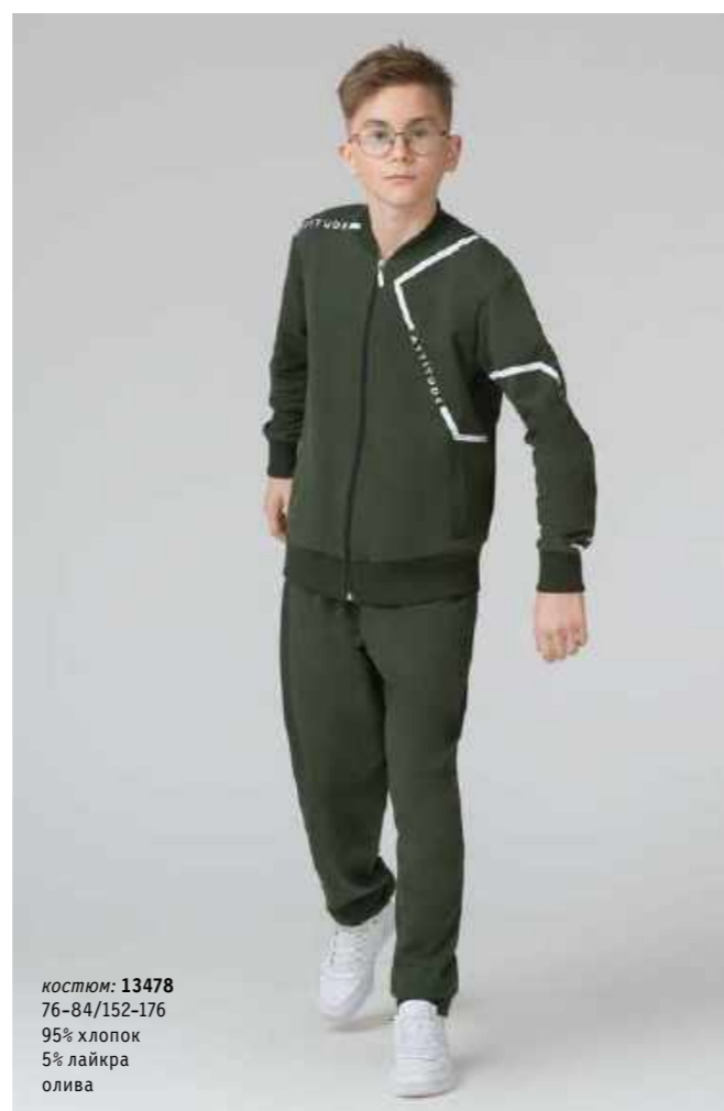
костюм: 13478 76-84/152-176 95% хлопок 5% лайкра олива

«ТОК» – энергия, импульс, движение, заряд.