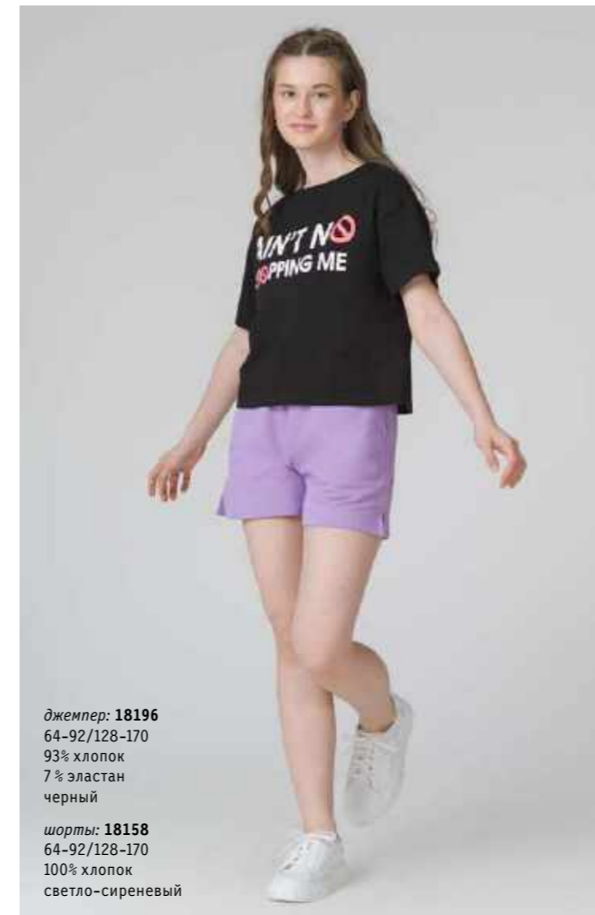
джерсер: 18196 64-92/128-170 93% хлопок 7% эластан черный шорты: 18158 64-92/128-170 100% хлопок светло-сиреневый