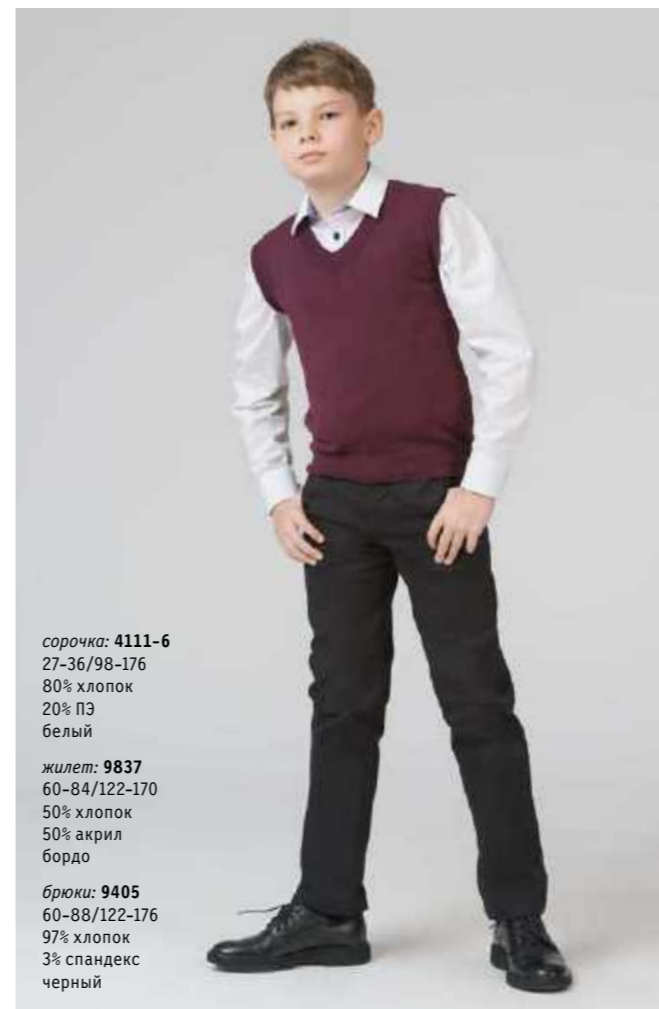
сорочка: 4111-6 27-36/98-176 80% хлопок 20% ПЭ белый жилет: 9837 60-84/122-170 50% хлопок 50% акрил бордо брюки: 9405 60-88/122-176 97% хлопок 3% спандекс черный