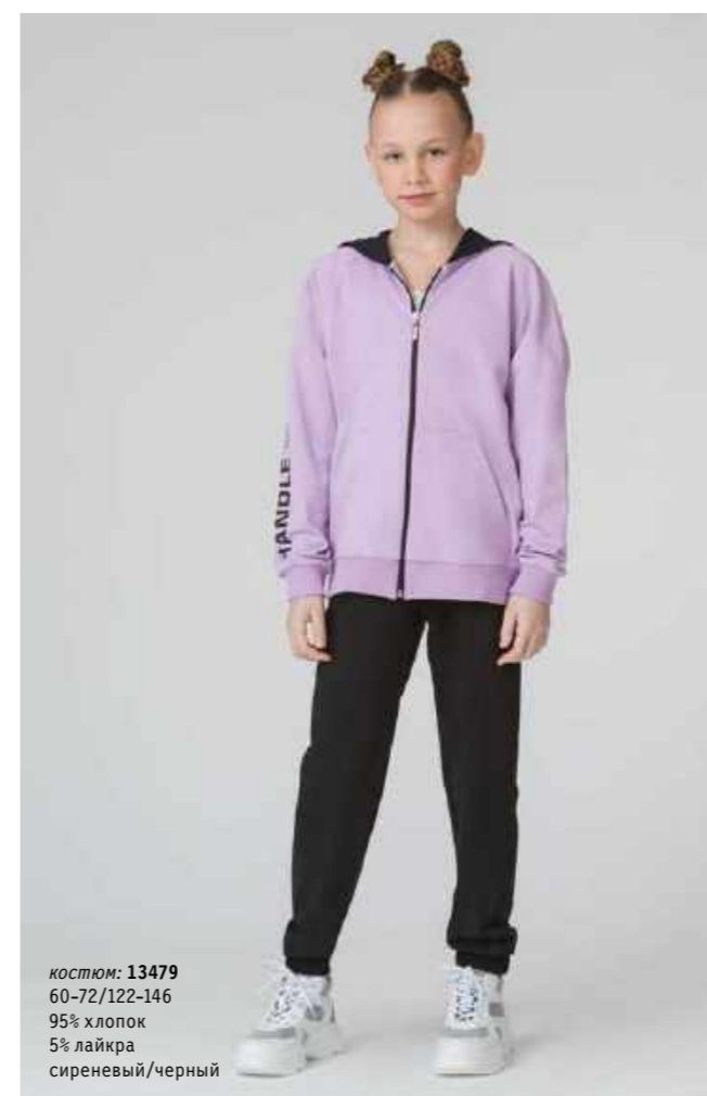
костюм: 13479 60-72/122-146 95% хлопок 5% лайкра сиреневый/черный