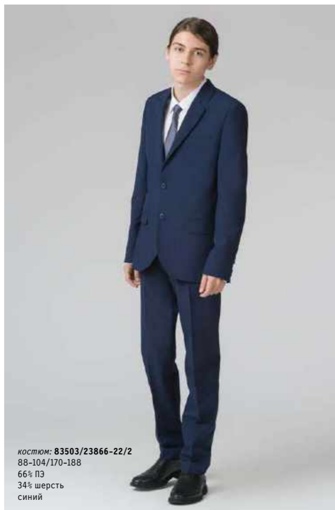
костюм: 83503/23866-22/2 88-104/170-188 66% ПЭ 34% шерсть синий