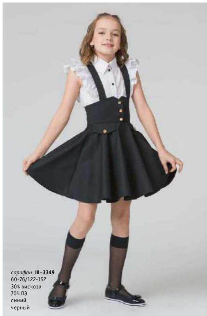
сарафан: Ш-3349 60-76/122-152 30% вискоза 70% ПЭ синий черный