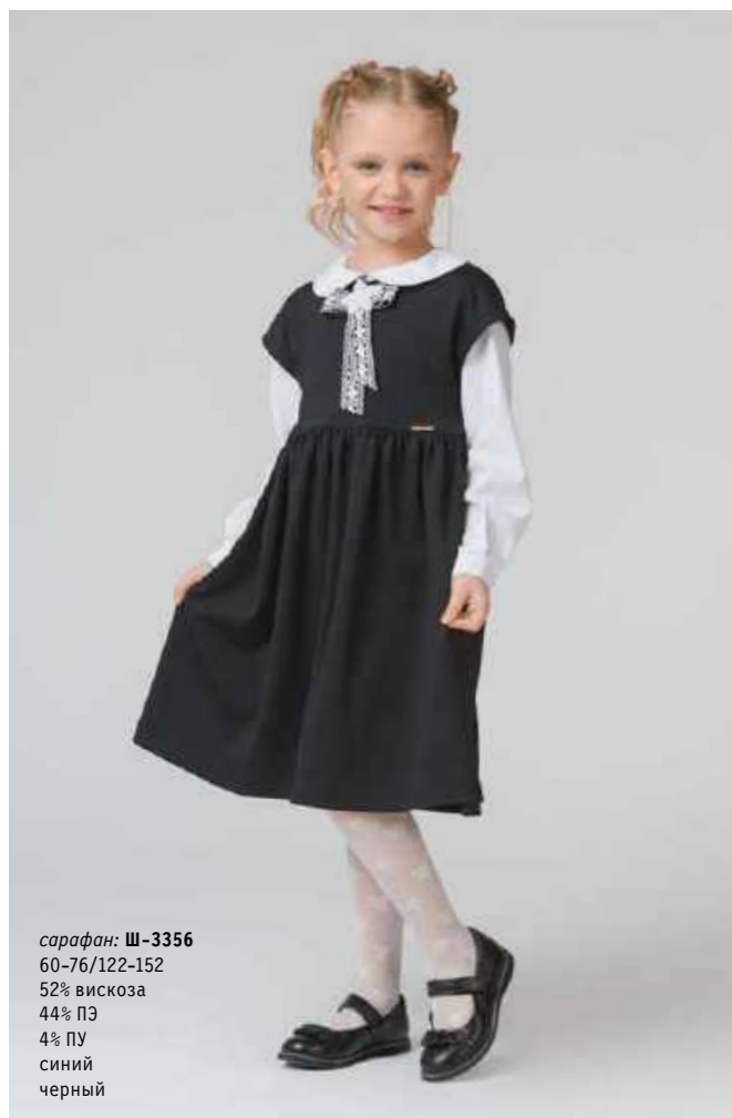
сарафан: Ш-3356 60-76/122-152 52% вискоза 44% ПЭ 4% ПУ синий черный