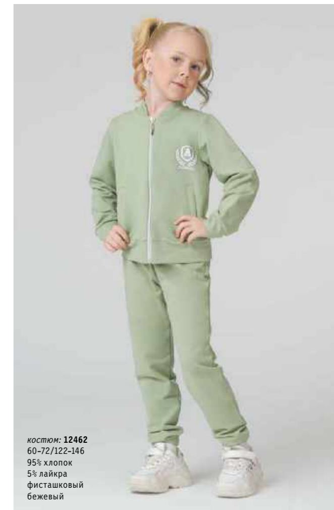
костюм: 12462 60-72/122-146 95% хлопок 5% лайкра фисташковый бежевый