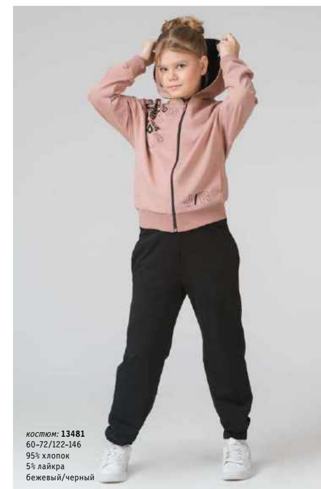
костюм: 13481 60-72/122-146 95% хлопок 5% лайкра бежевый/черный