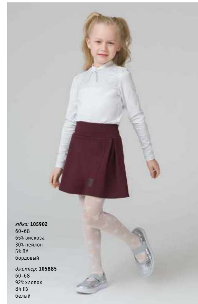
юбка: 105902 60-68 65% вискоза 30% нейлон 5% ПУ бордовый