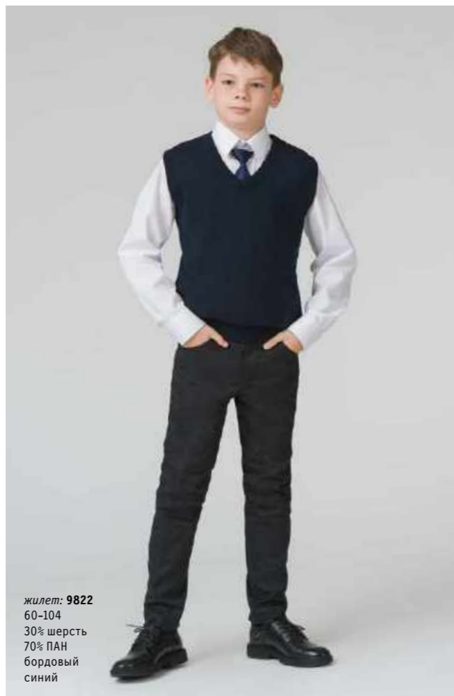
жилет: 9822 60-104 30% шерсть 70% ПАН бордовый синий