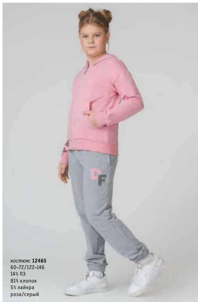
костюм: 12465 60-72/122-146 14% ПЭ 81% хлопок 5% лайкра роза/серый