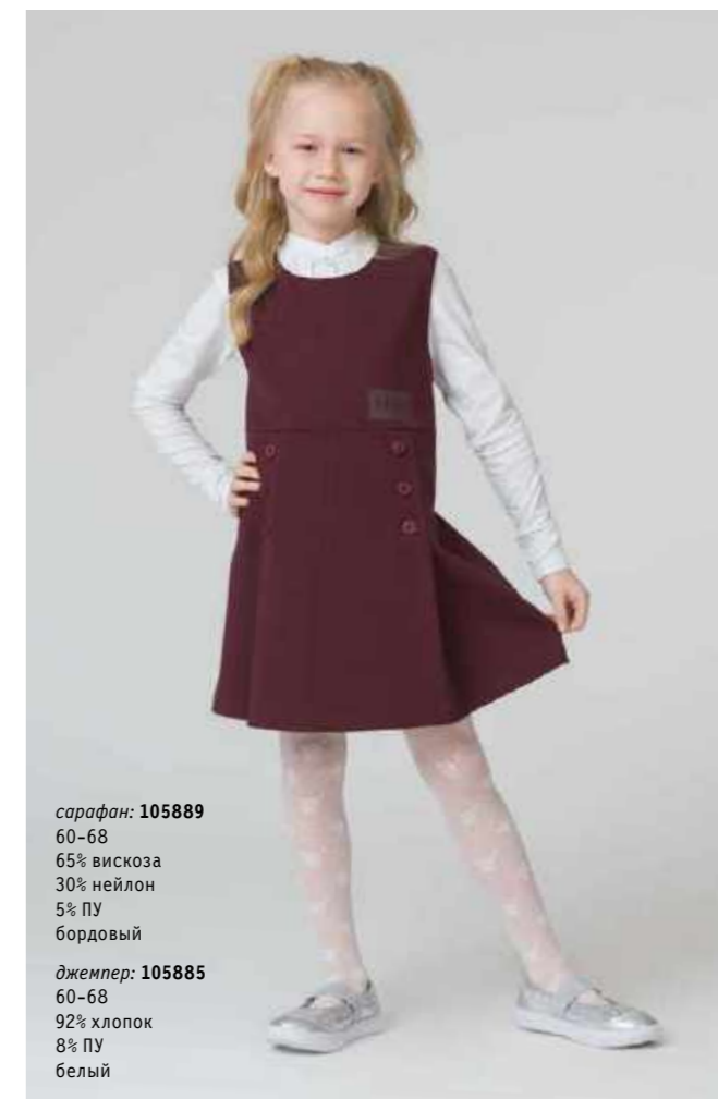
сарафан: 105889 60-68 65% вискоза 30% нейлон 5% ПУ бордовый