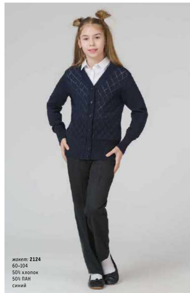
жакет: 2124 60-104 50% хлопок 50% ПАН синий