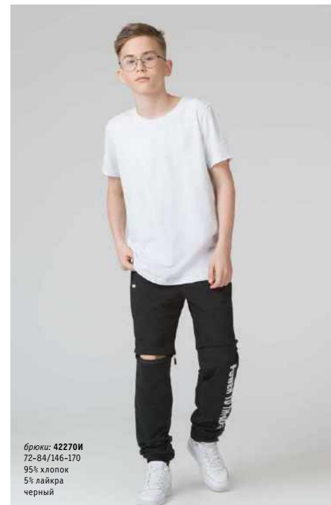
брюки: 42270И 72-84/146-170 95% хлопок 5% лайкра черный