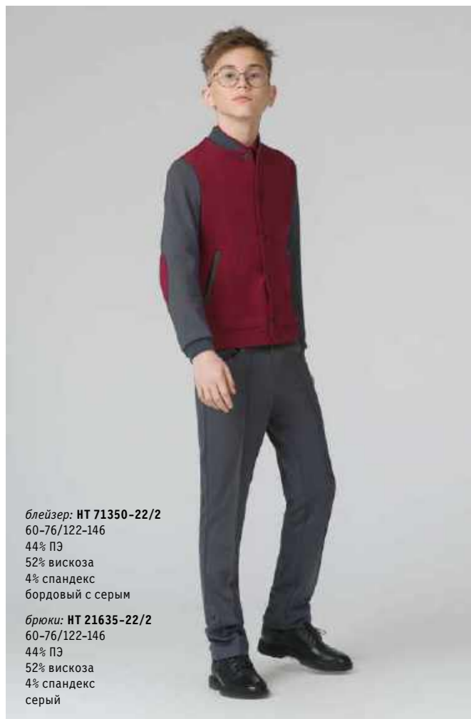
блейзер: НТ 71350-22/2 60-76/122-146 44% ПЭ 52% вискоза 4% спандекс бордовый с серым