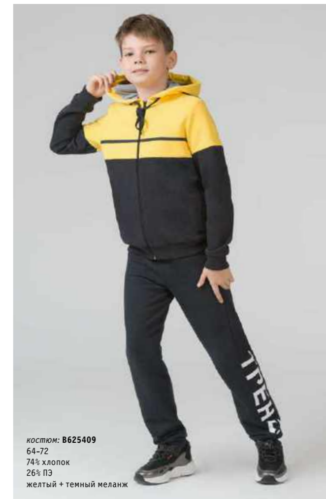
костюм: В625409 64-72 74% хлопок 26% ПЭ желтый + темный меланж