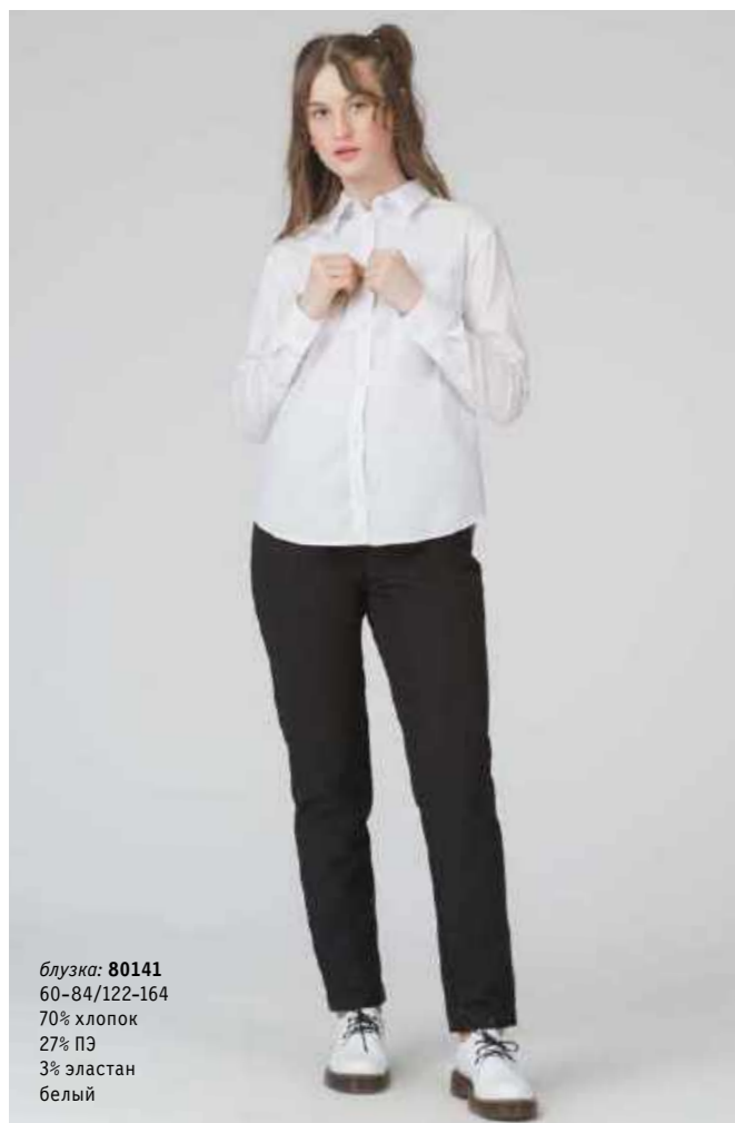
блузка: 80141 60-84/122-164 70% хлопок 27% ПЭ 3% эластан белый