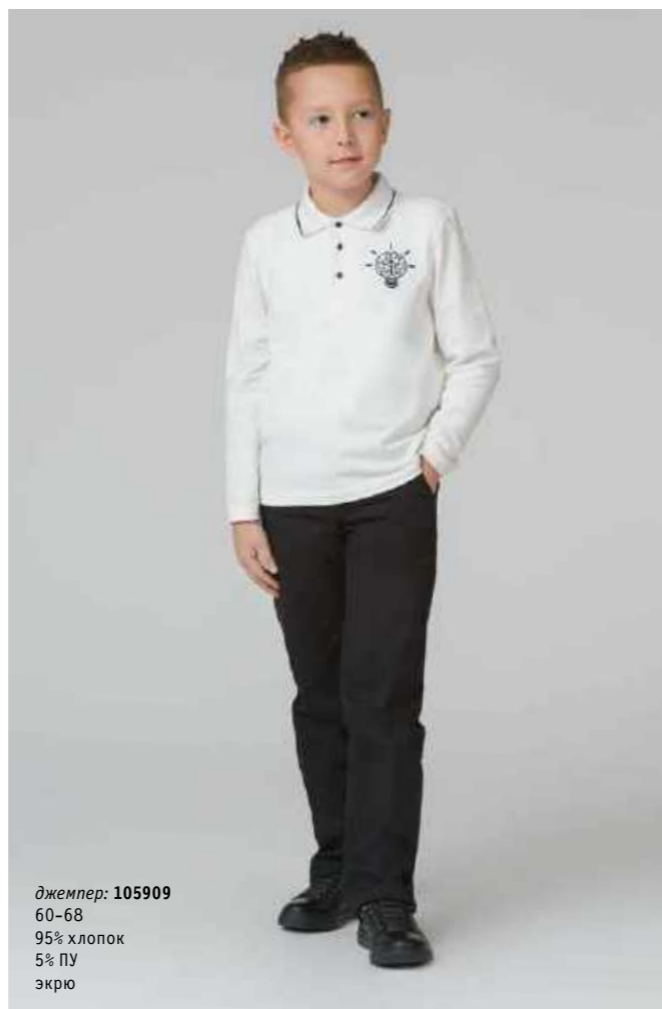
джерпер: 105909 60-68 95% хлопок 5% ПУ экрю