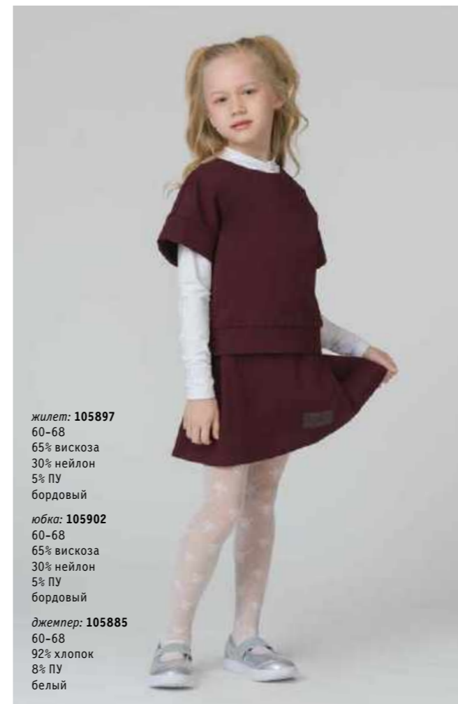
жилет: 105897 60-68 65% вискоза 30% нейлон 5% ПУ бордовый