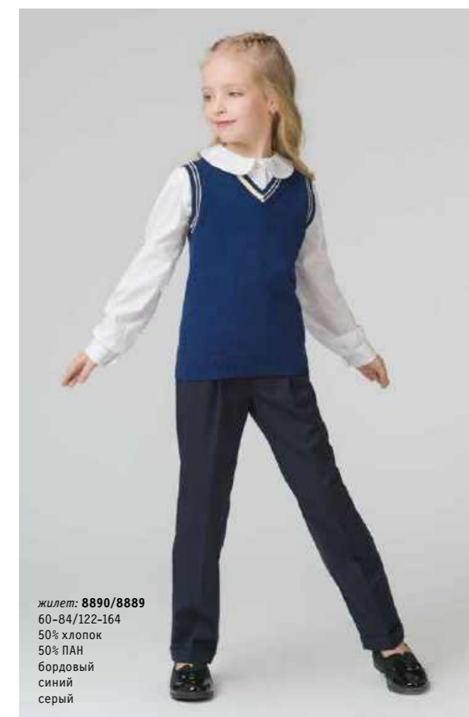
жилет: 8890/8889 60-84/122-164 50% хлопок 50% ПАН бордовый синий серый