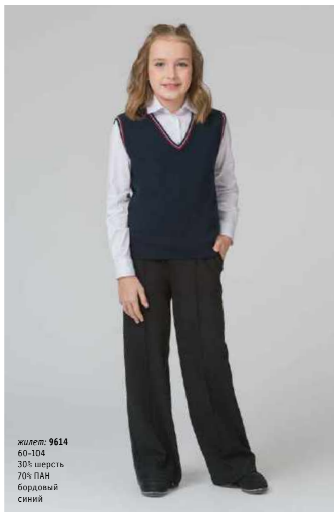
жилет: 9614 60-104 30% шерсть 70% ПАН бордовый синий