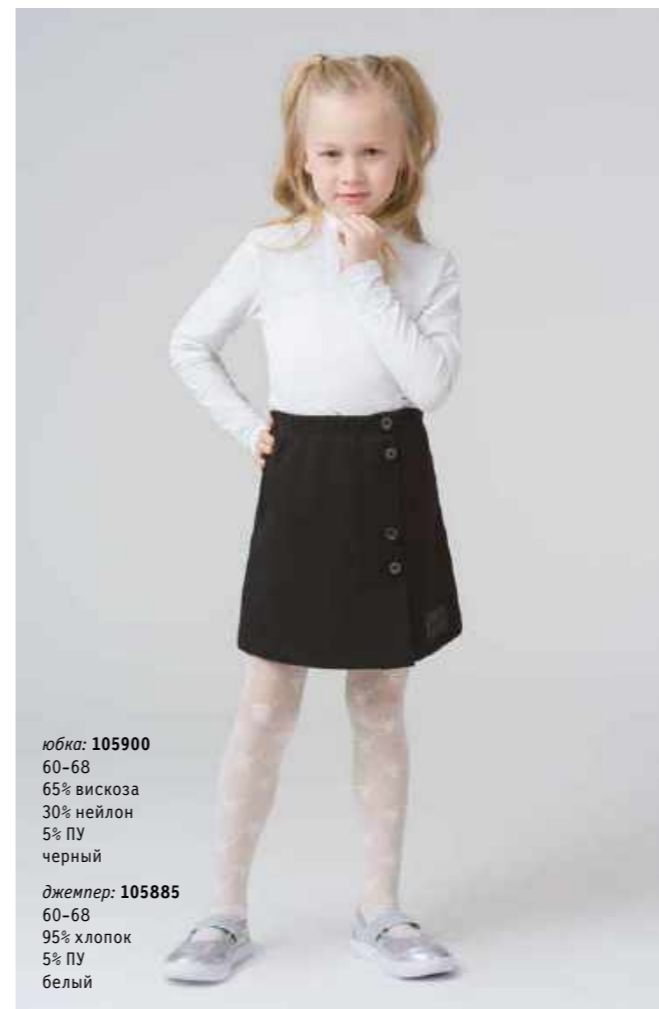
юбка: 105900 60-68 65% вискоза 30% нейлон 5% ПУ черный джерпер: 105885 60-68 95% хлопок 5% ПУ белый