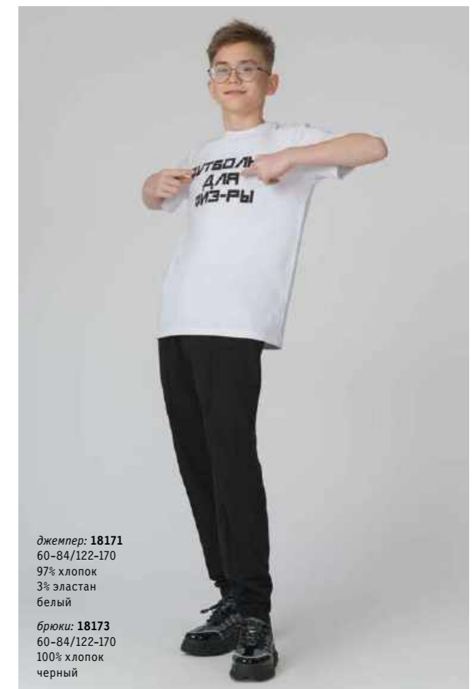
джерсер: 18171 60-84/122-170 97% хлопок 3% эластан белый брюки: 18173 60-84/122-170 100% хлопок черный