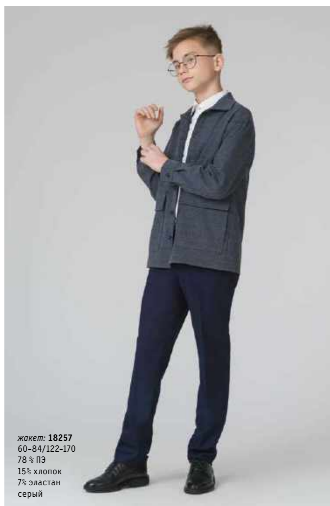
жакет: 18257 60-84/122-170 78% ПЭ 15% хлопок 7% эластан серый