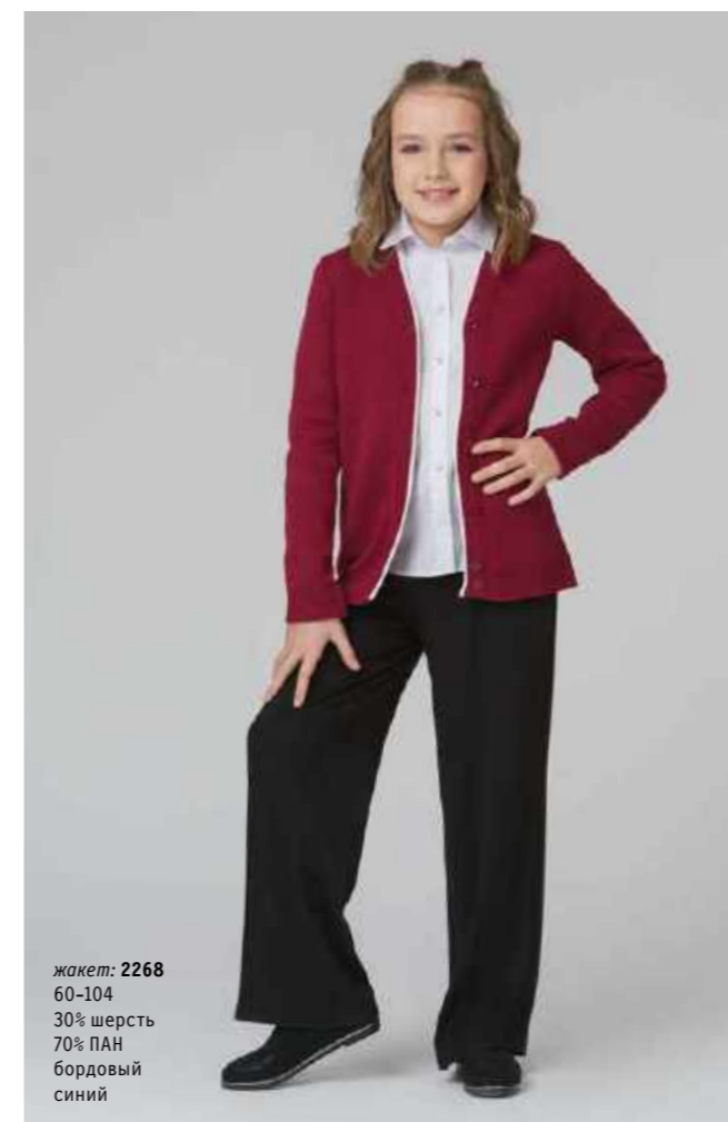
жакет: 2268 60-104 30% шерсть 70% ПАН бордовый синий

Коллекция состоит из изделий для девочек и мальчиков в классических расцветках. Правильный крой и эластичные ткани идеально подходят на любую комплекцию и помогают правильно расставлять акценты. Безупречное качество делает одежду удобной и практичной в ежедневной носке.