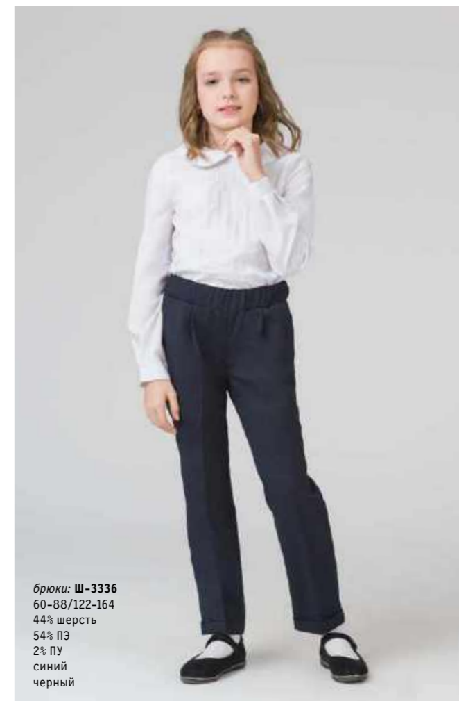
брюки: Ш-3336 60-88/122-164 44% шерсть 54% ПЭ 2% ПУ синий черный