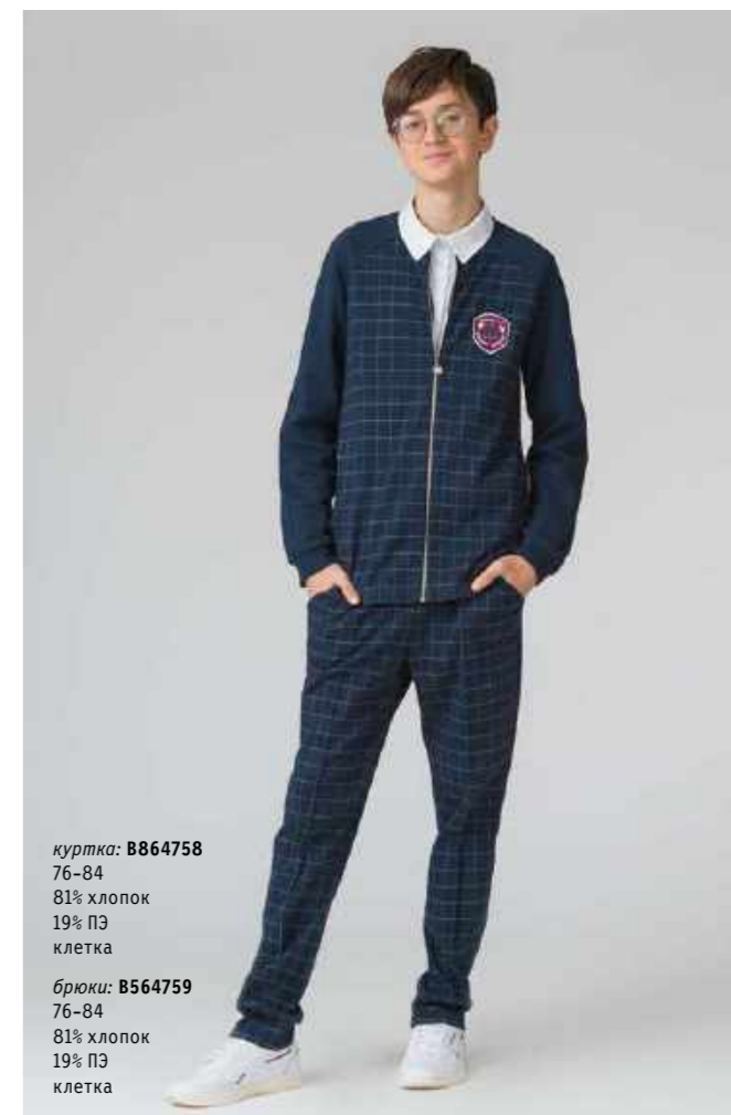
куртка: B864758 76-84 81% хлопок 19% ПЭ клетка