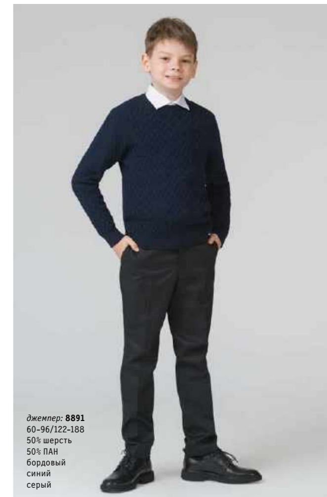
джерсер: 8891 60-96/122-188 50% шерсть 50% ПАН бордовый синий серый