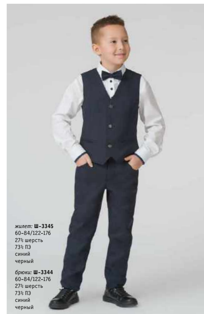
жилет: Ш-3345 60-84/122-176 27% шерсть 73% ПЭ синий черный брюки: Ш-3344 60-84/122-176 27% шерсть 73% ПЭ синий черный