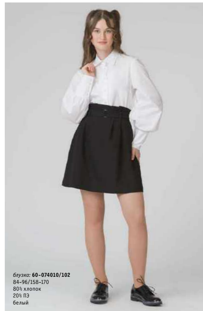
блузка: 60-074010/102 84-96/158-170 80% хлопок 20% ПЭ белый