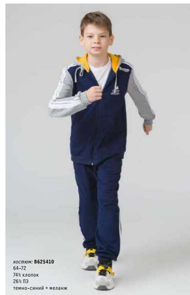
костюм: В625410 64-72 74% хлопок 26% ПЭ темно-синий + меланж