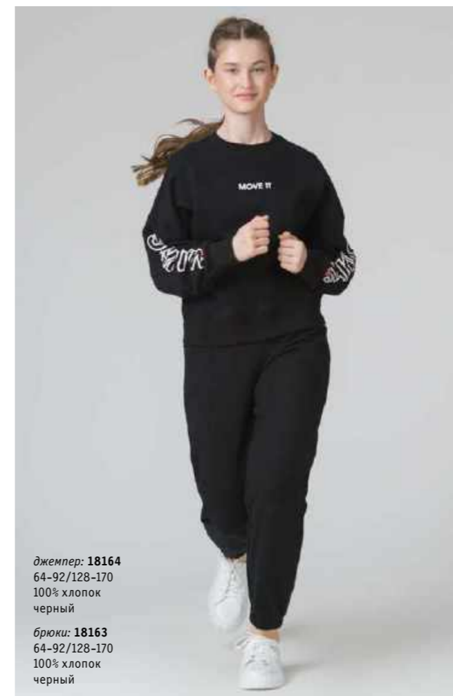
джерсер: 18164 64-92/128-170 100% хлопок черный брюки: 18163 64-92/128-170 100% хлопок черный