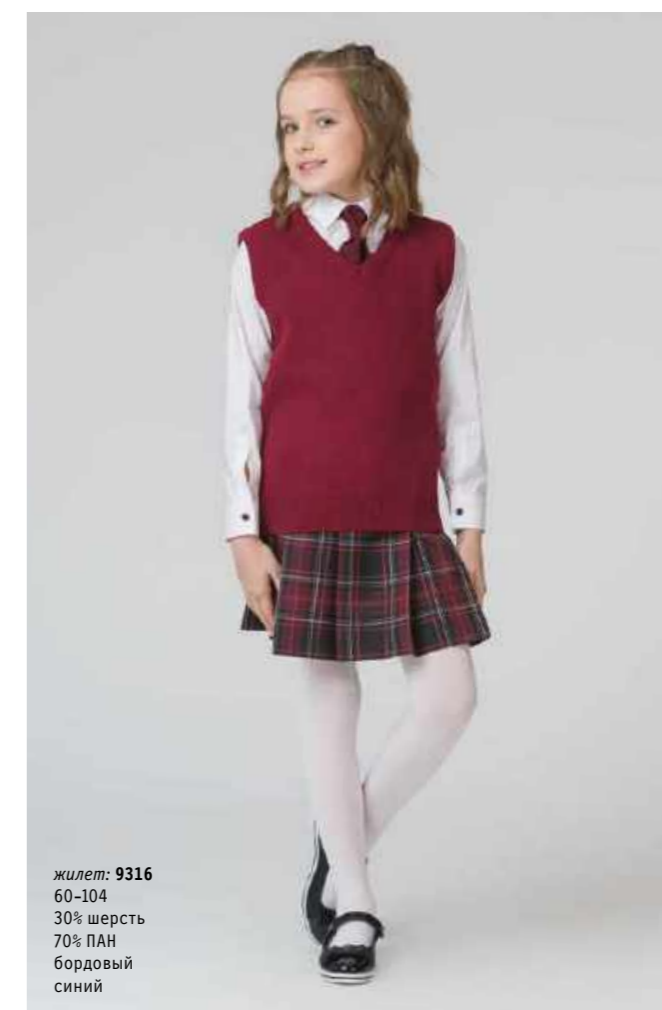
жилет: 9316 60-104 30% шерсть 70% ПАН бордовый синий