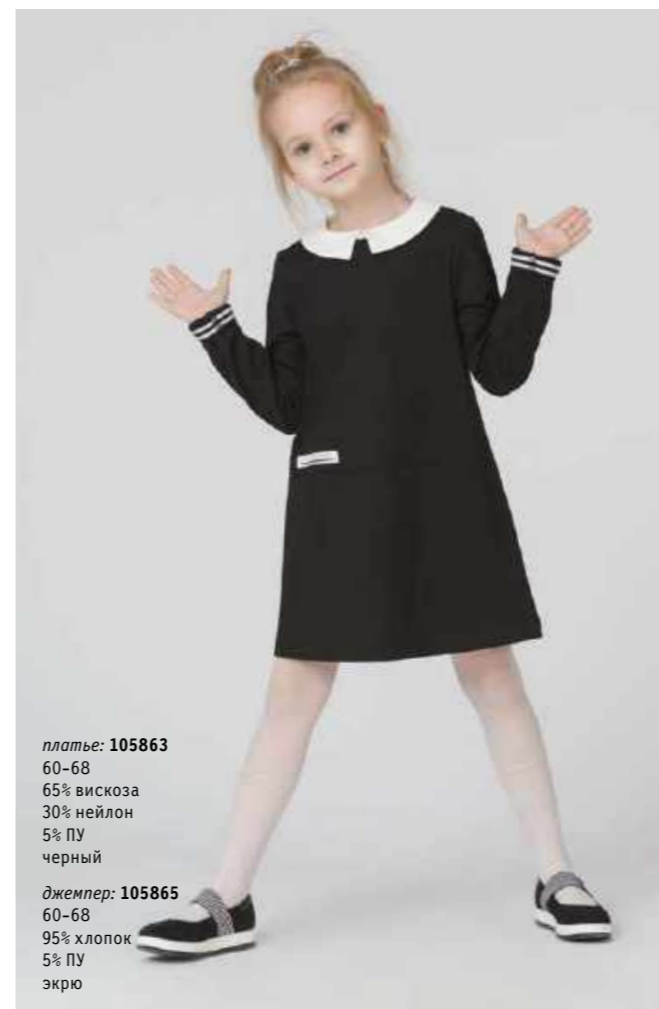
платье: 105863 60-68 65% вискоза 30% нейлон 5% ПУ черный джерпер: 105865 60-68 95% хлопок 5% ПУ экрю