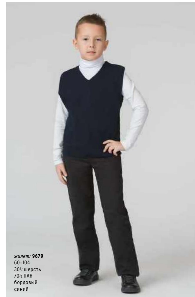
жилет: 9679 60-104 30% шерсть 70% ПАН бордовый синий