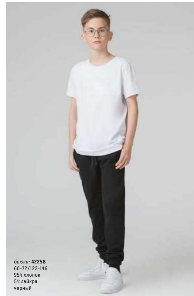
брюки: 42258 60-72/122-146 95% хлопок 5% лайкра черный