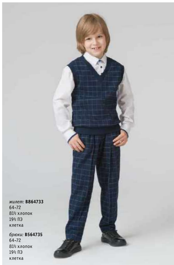
жилет: B864733 64-72 81% хлопок 19% ПЭ клетка

Одежда ОАО «СВІТАНАК» сочетает в себе современность, модный дизайн и высокое качество изделий по доступным ценам. Универсальность наших коллекций позволяет легко и просто комбинировать модели друг с другом и всегда выглядеть стильно и уверенно.