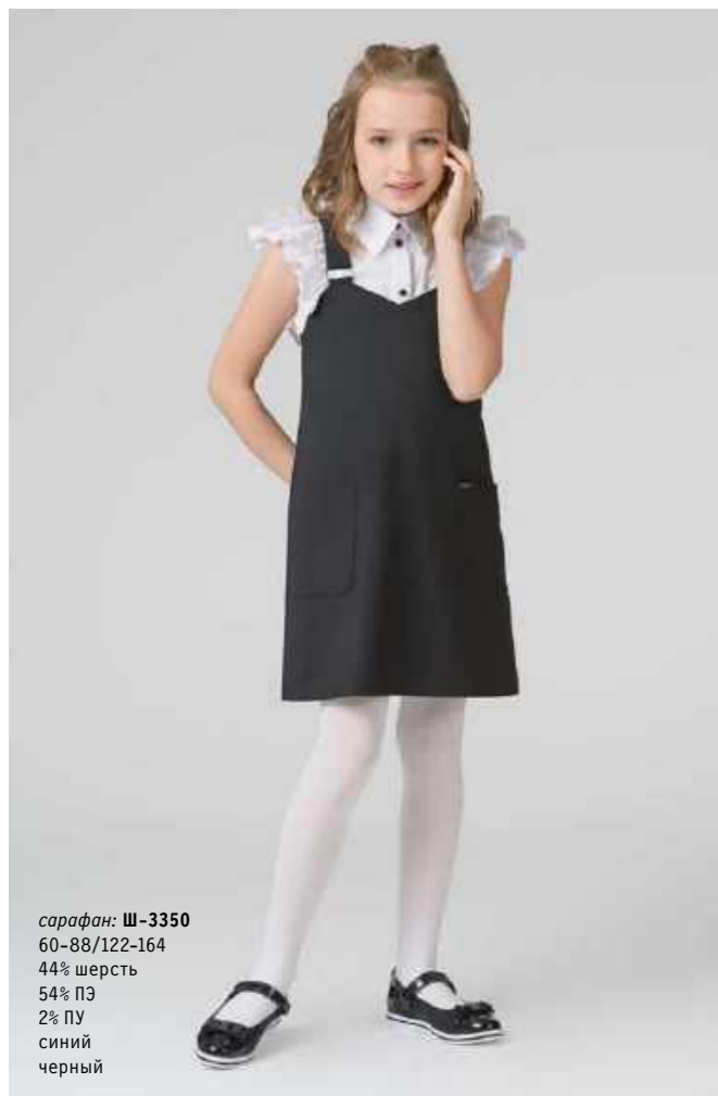
сарафан: Ш-3350 60-88/122-164 44% шерсть 54% ПЭ 2% ПУ синий черный