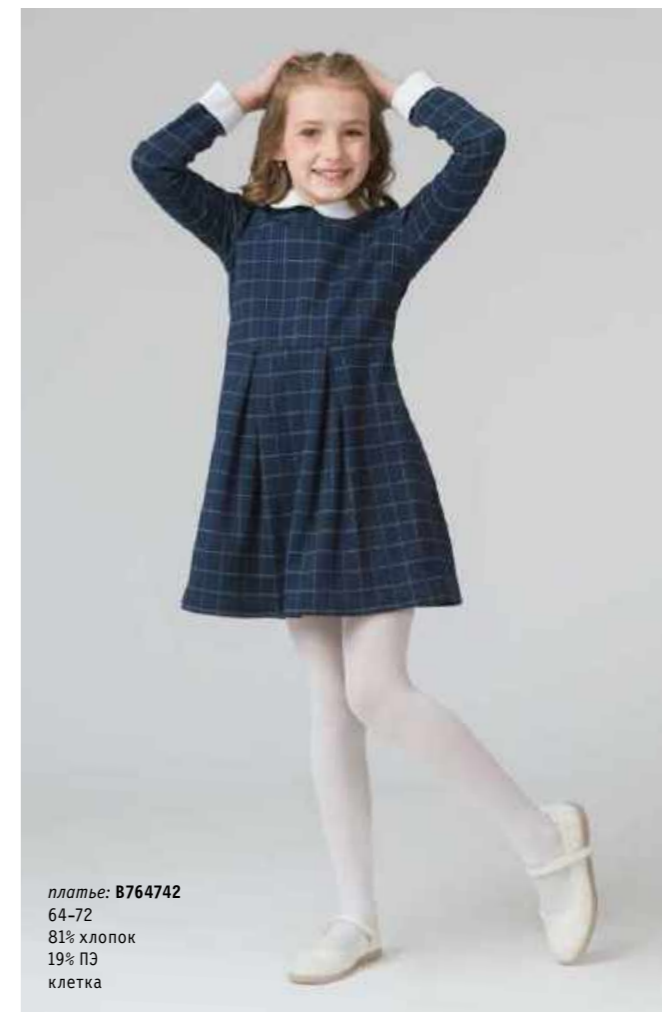
платье: B764742 64-72 81% хлопок 19% ПЭ клетка