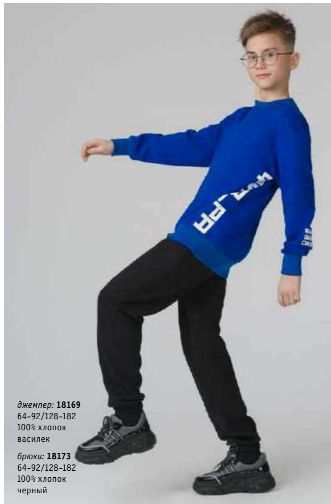
джерсер: 18169 64-92/128-182 100% хлопок василек