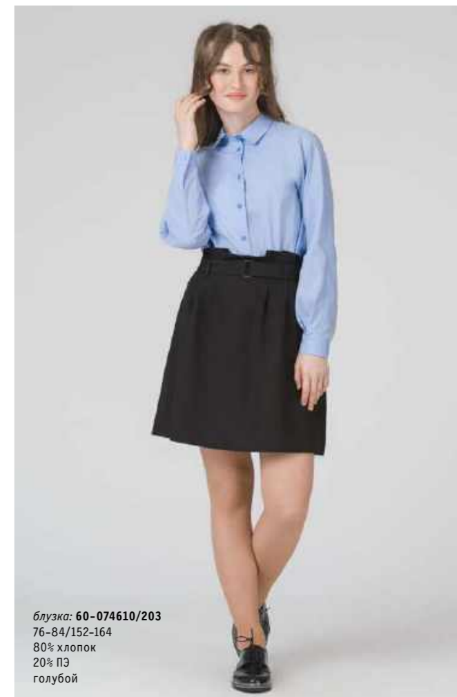
блузка: 60-074610/203 76-84/152-164 80% хлопок 20% ПЭ голубой