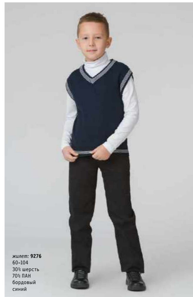
жилет: 9276 60-104 30% шерсть 70% ПАН бордовый синий