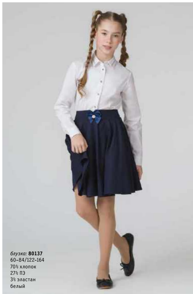
блузка: 80137 60-84/122-164 70% хлопок 27% ПЭ 3% эластан белый