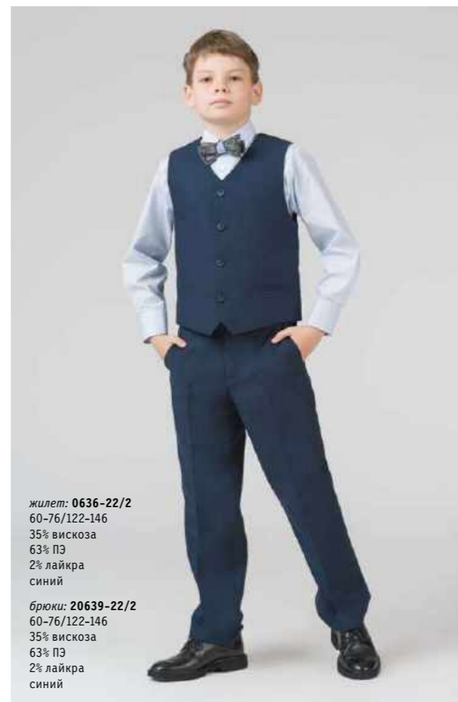
жилет: 0636-22/2 60-76/122-146 35% вискоза 63% ПЭ 2% лайкра синий