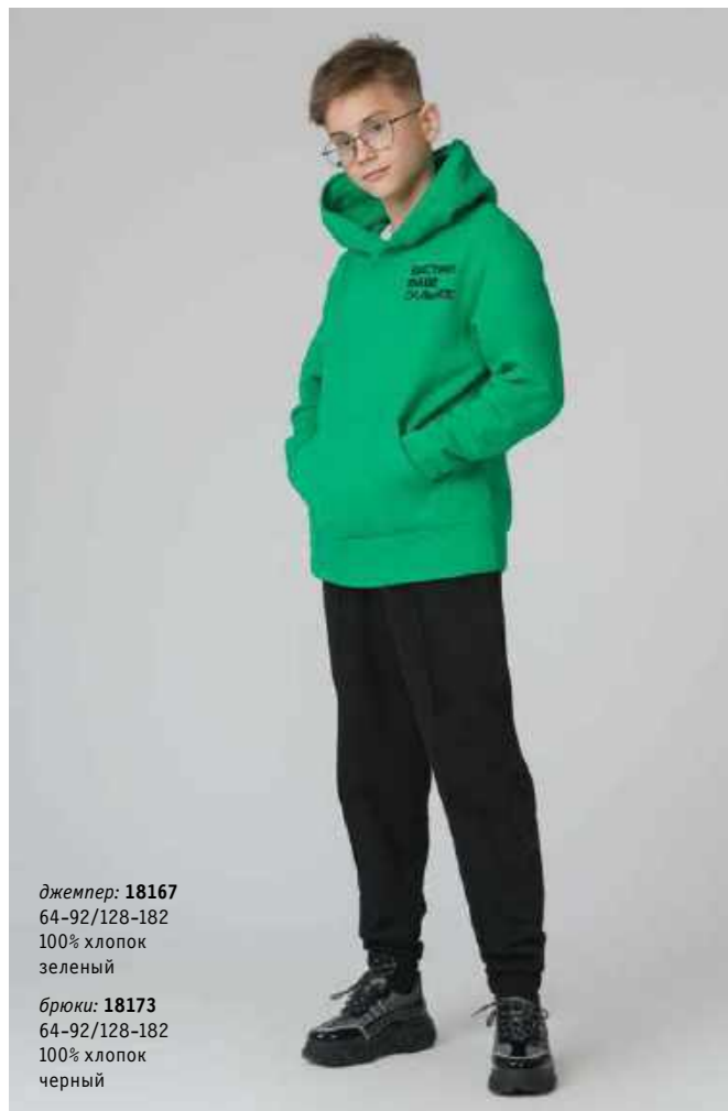
джерсер: 18167 64-92/128-182 100% хлопок зеленый