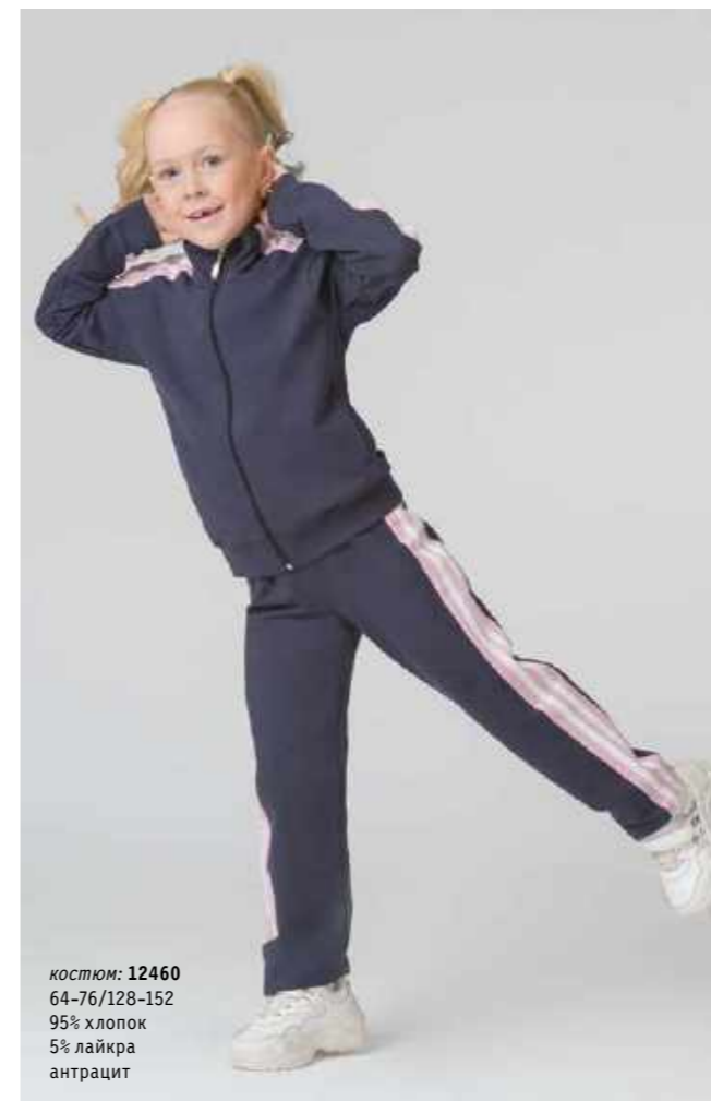
костюм: 12460 64-76/128-152 95% хлопок 5% лайкра антрацит