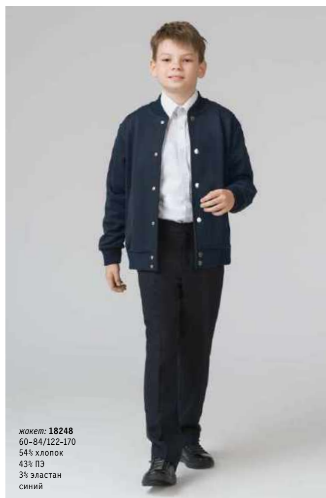
жакет: 18248 60-84/122-170 54% хлопок 43% ПЭ 3% эластан синий