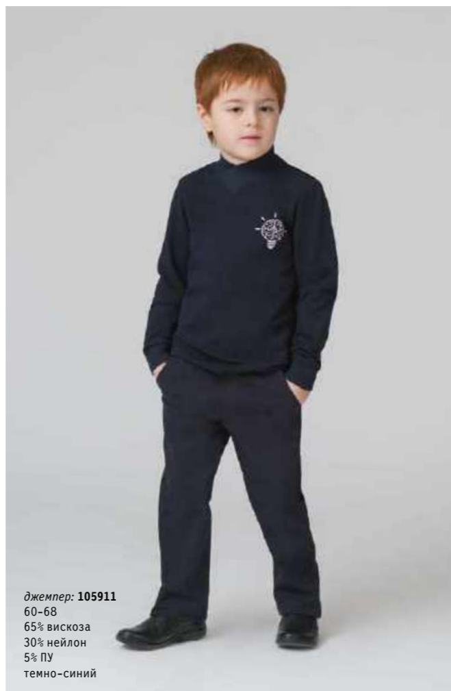
джерсер: 105911 60-68 65% вискоза 30% нейлон 5% ПУ темно-синий