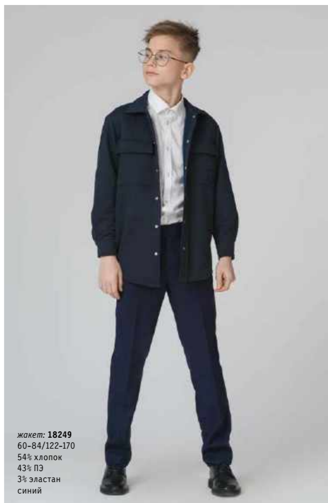
жакет: 18249 60-84/122-170 54% хлопок 43% ПЭ 3% эластан синий

Школьная коллекция ОАО «8 Марта» разработана для стильных и гармоничных учеников. Отличается современным дизайном, комфортом, сочетанием в одежде урбанистической культуры, «взрослой деловой» классики и элементов подростковой непосредственности. Коллекция включает как деловую одежду для школы "School", так и спортивную «Физ-ра».