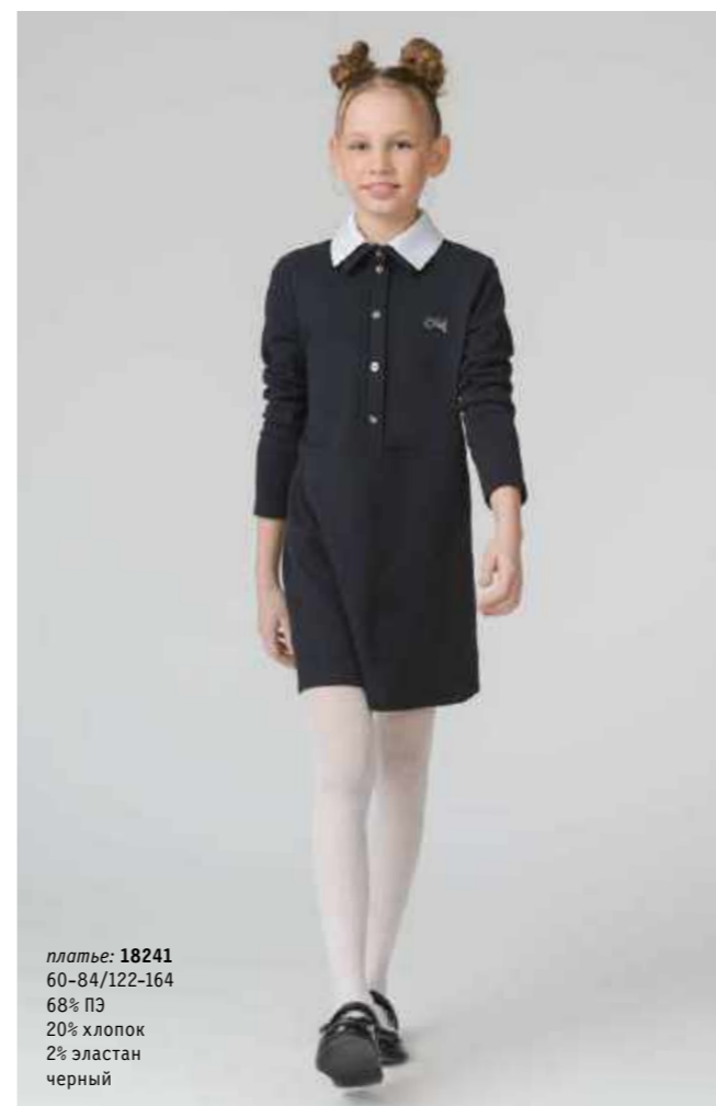
платье: 18241 60-84/122-164 68% ПЭ 20% хлопок 2% эластан черный