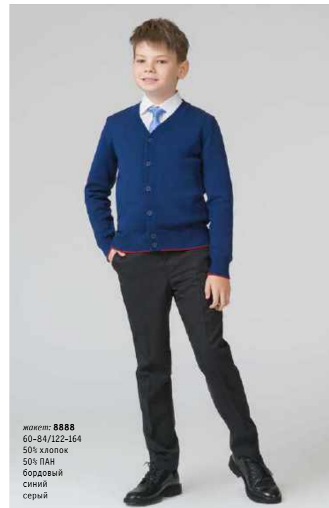
жакет: 8888 60-84/122-164 50% хлопок 50% ПАН бордовый синий серый