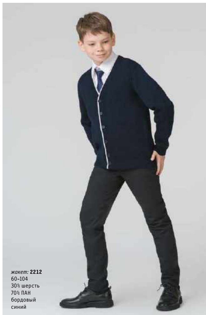
жакет: 2212 60-104 30% шерсть 70% ПАН бордовый синий