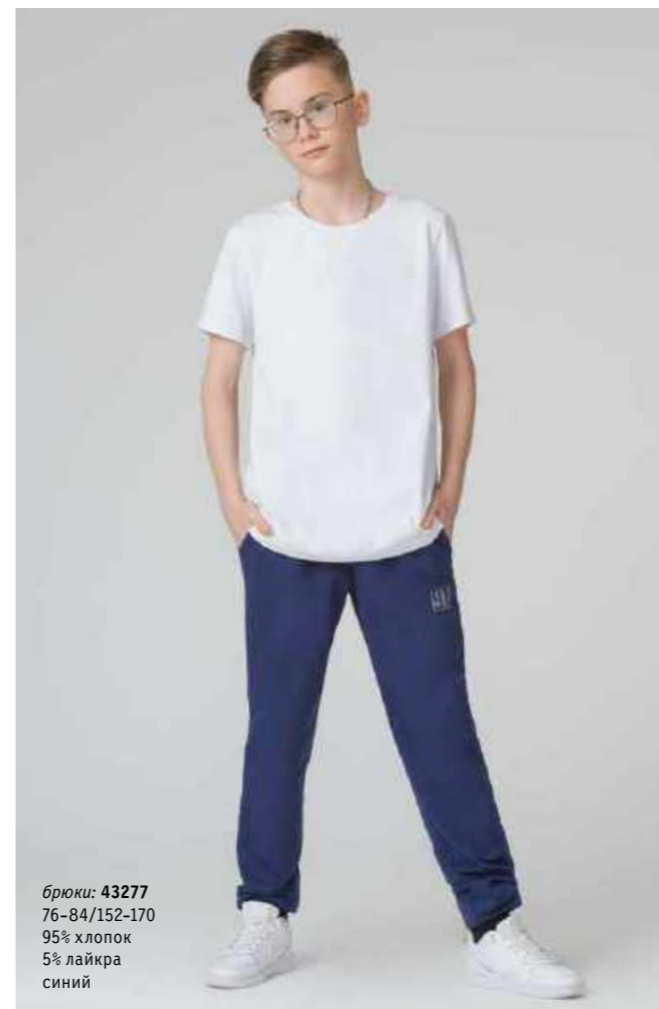
брюки: 43277 76-84/152-170 95% хлопок 5% лайкра синий