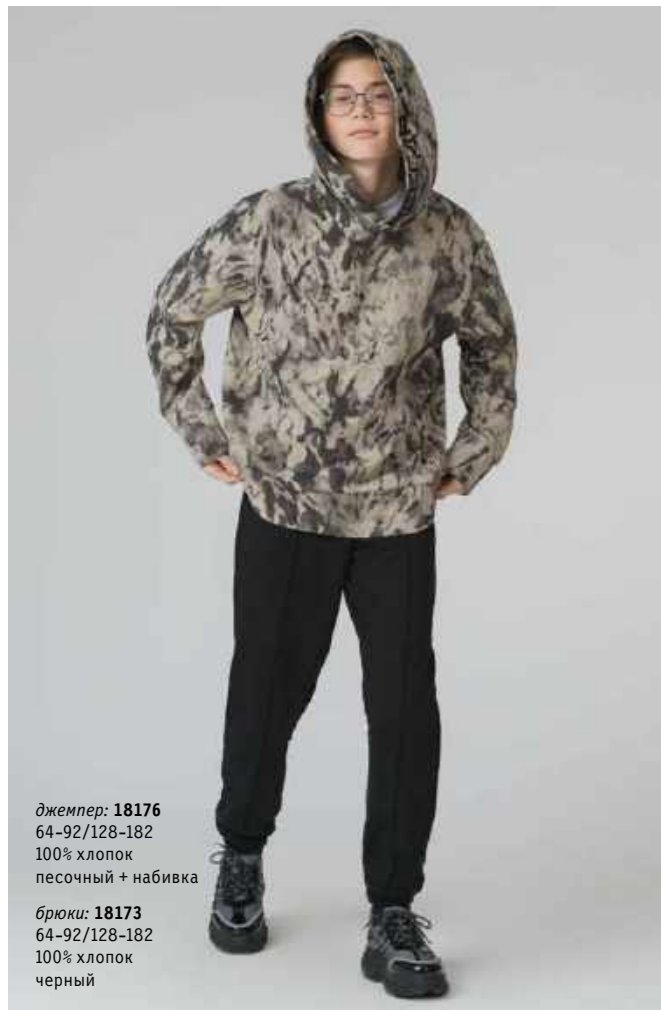
джерсер: 18176 64-92/128-182 100% хлопок песочный + набивка