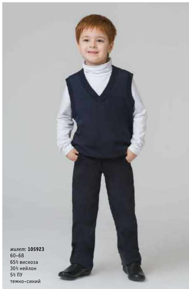
жилет: 105923 60-68 65% вискоза 30% нейлон 5% ПУ темно-синий