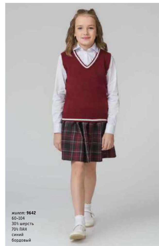
жилет: 9642 60-104 30% шерсть 70% ПАН синий бордовый