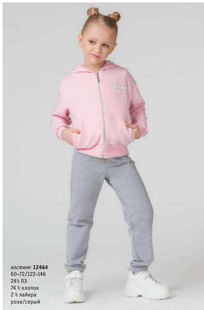
костюм: 12464 60-72/122-146 24% ПЭ 74% хлопок 2% лайкра роза/серый