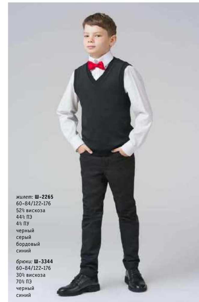
жилет: Ш-2265 60-84/122-176 52% вискоза 44% ПЭ 4% ПУ черный серый бордовый синий брюки: Ш-3344 60-84/122-176 30% вискоза 70% ПЭ черный синий