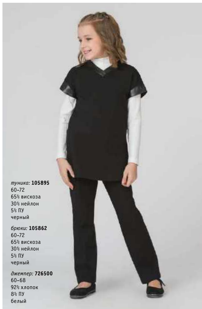
туника: 105895 60-72 65% вискоза 30% нейлон 5% ПУ черный