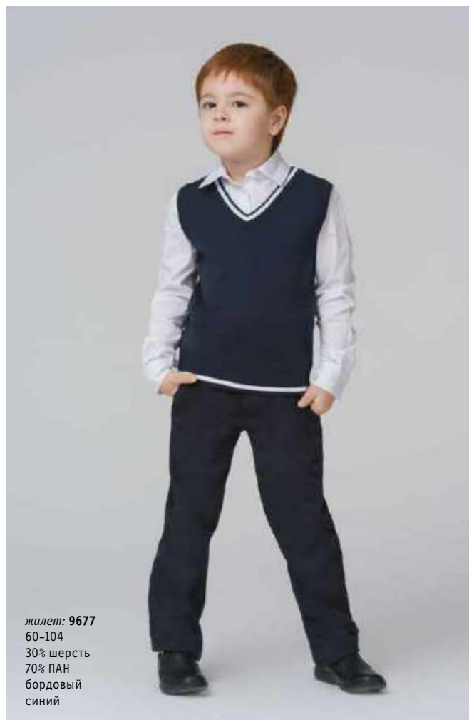
жилет: 9677 60-104 30% шерсть 70% ПАН бордовый синий