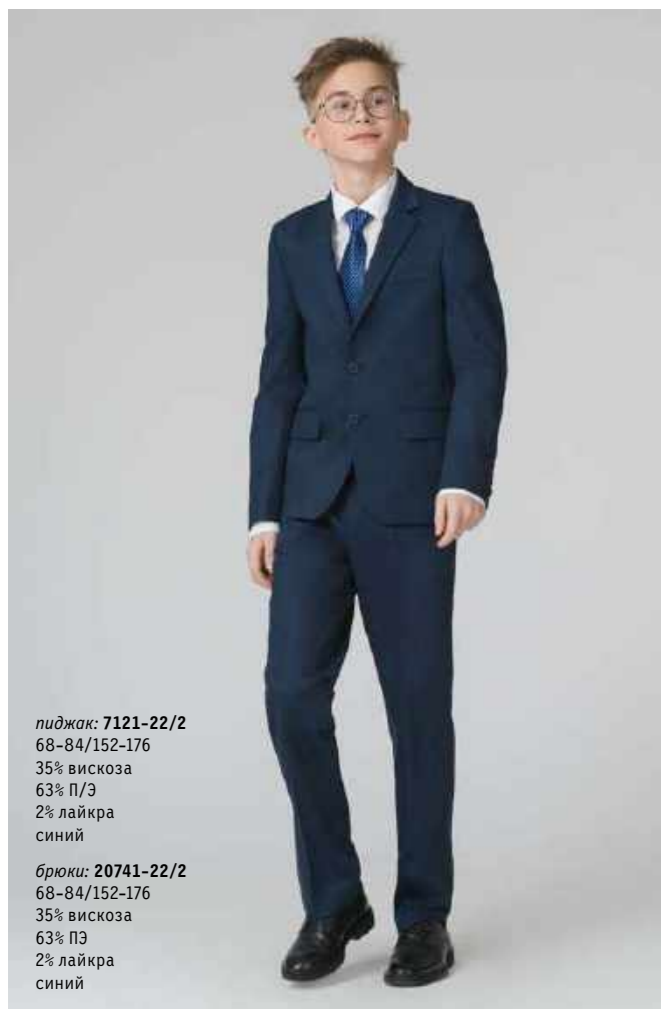
пиджак: 7121-22/2 68-84/152-176 35% вискоза 63% П/Э 2% лайкра синий