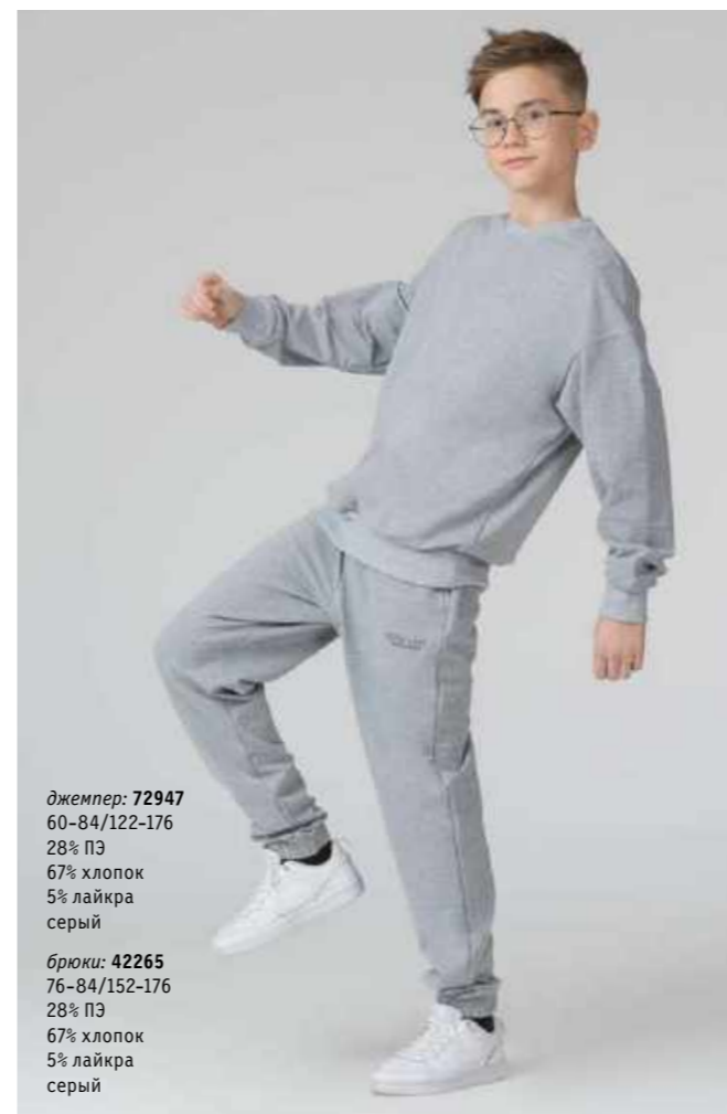
джерсер: 72947 60-84/122-176 28% ПЭ 67% хлопок 5% лайкра серый брюки: 42265 76-84/152-176 28% ПЭ 67% хлопок 5% лайкра серый