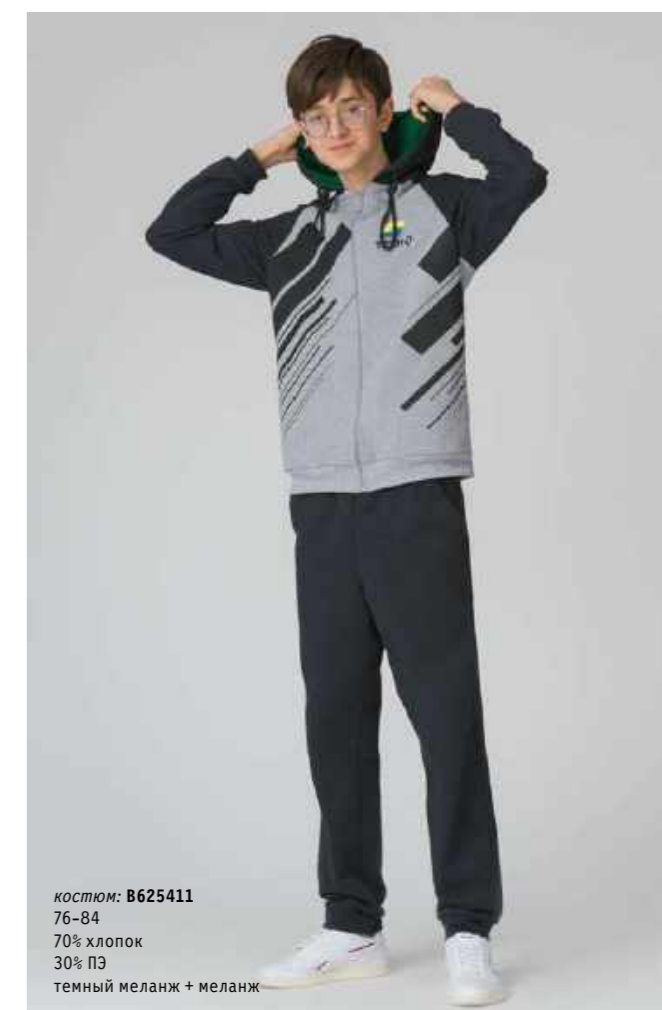
костюм: В625411 76-84 70% хлопок 30% ПЭ темный меланж + меланж