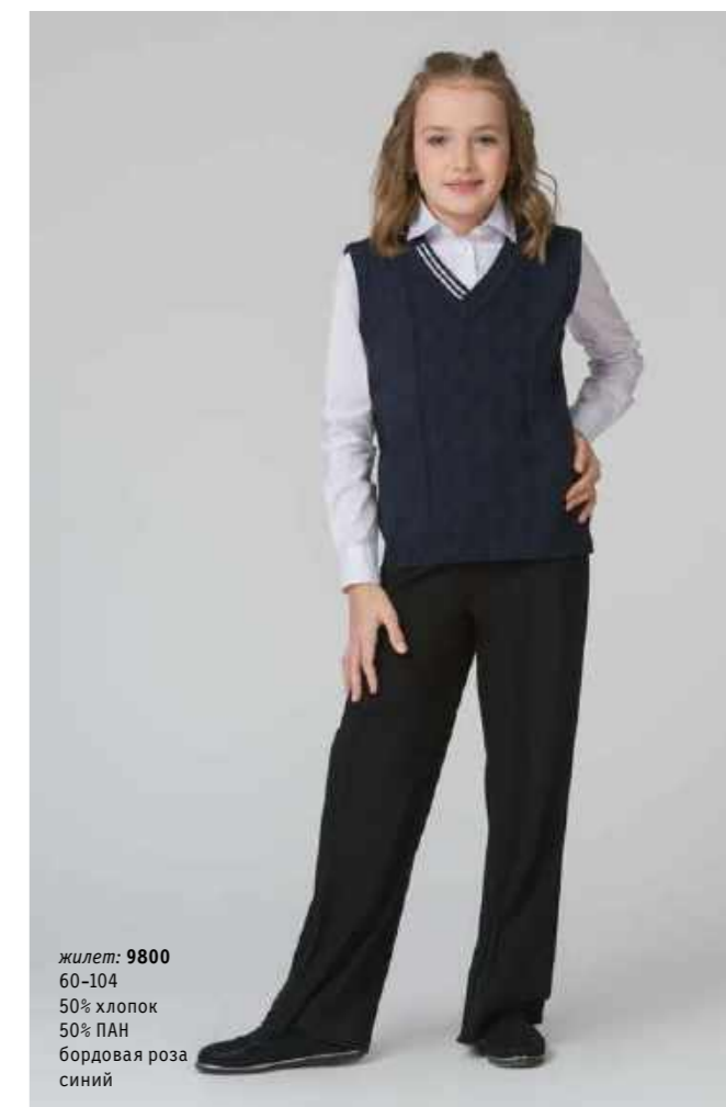
жилет: 9800 60-104 50% хлопок 50% ПАН бордовая роза синий