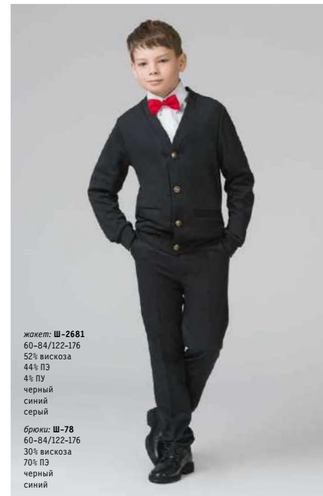
жакет: Ш-2681 60-84/122-176 52% вискоза 44% ПЭ 4% ПУ черный синий серый брюки: Ш-78 60-84/122-176 30% вискоза 70% ПЭ черный синий

Коллекция от ОАО «Жлобинская швейная фабрика» подарит Вам удобство, комфорт и радость!