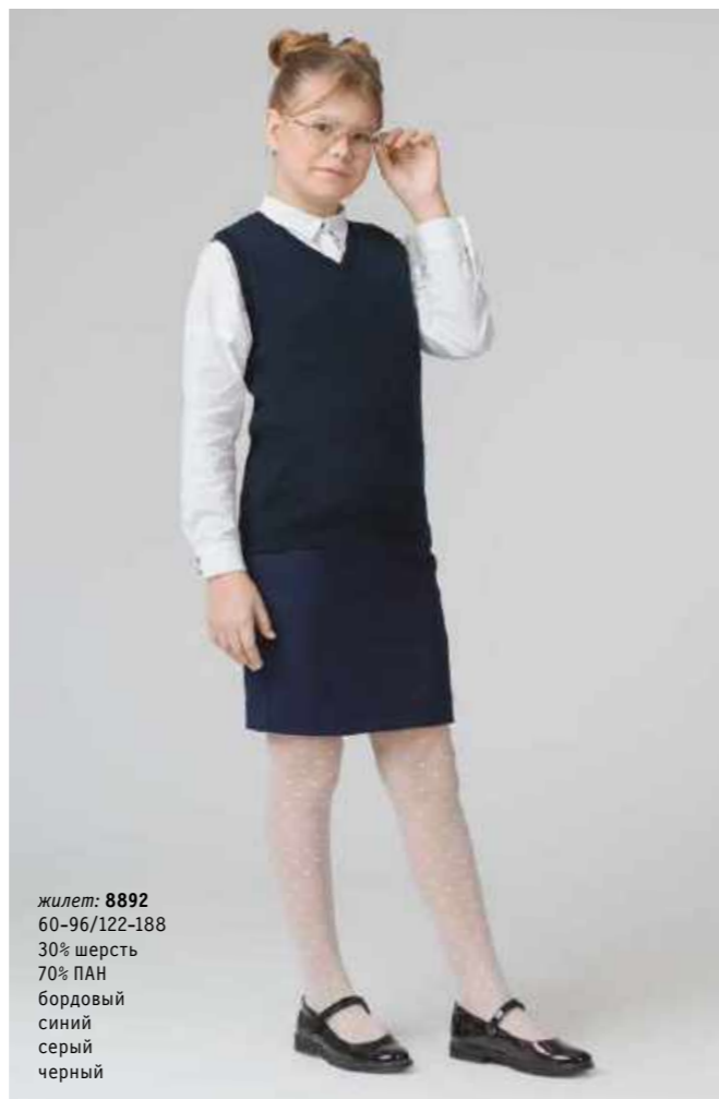
жилет: 8892 60-96/122-188 30% шерсть 70% ПАН бордовый синий серый черный

Качество продукции ОАО «Алеся» отвечает самым высоким Европейским критериям.