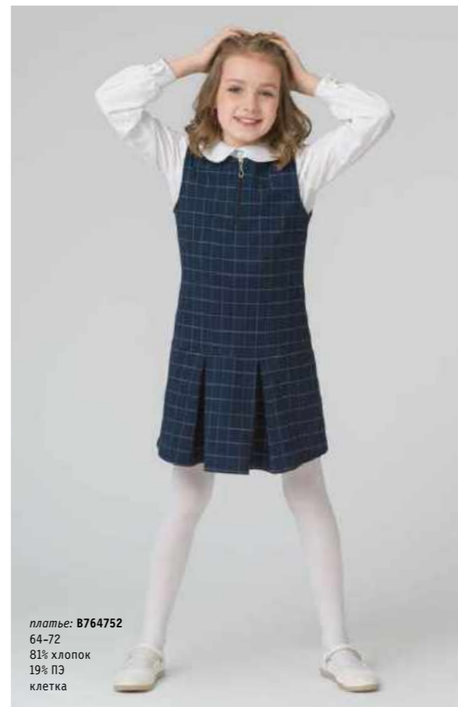
платье: B764752 64-72 81% хлопок 19% ПЭ клетка