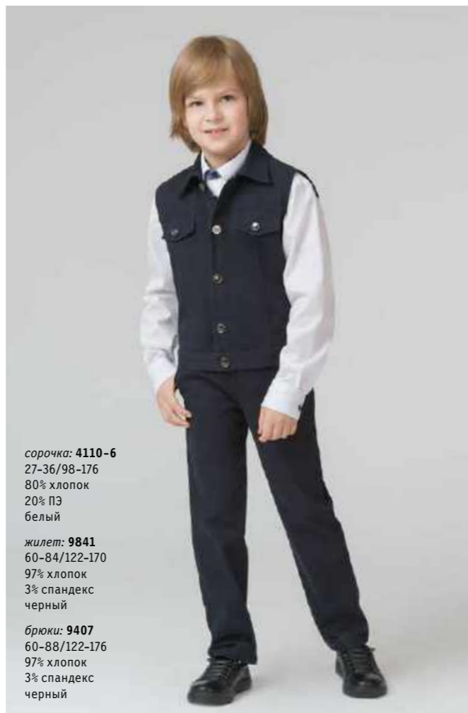
сорочка: 4110-6 27-36/98-176 80% хлопок 20% ПЭ белый жилет: 9841 60-84/122-170 97% хлопок 3% спандекс черный брюки: 9407 60-88/122-176 97% хлопок 3% спандекс черный