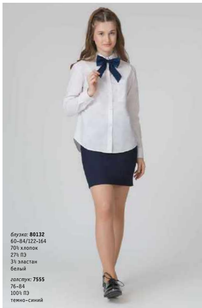
блузка: 80132 60-84/122-164 70% хлопок 27% ПЭ 3% эластан белый галстук: 7555 76-84 100% ПЭ темно-синий