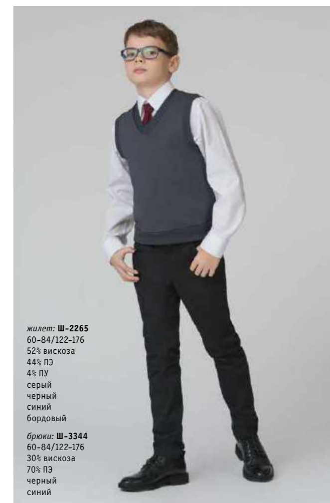
жилет: Ш-2265 60-84/122-176 52% вискоза 44% ПЭ 4% ПУ серый черный синий бордовый брюки: Ш-3344 60-84/122-176 30% вискоза 70% ПЭ черный синий