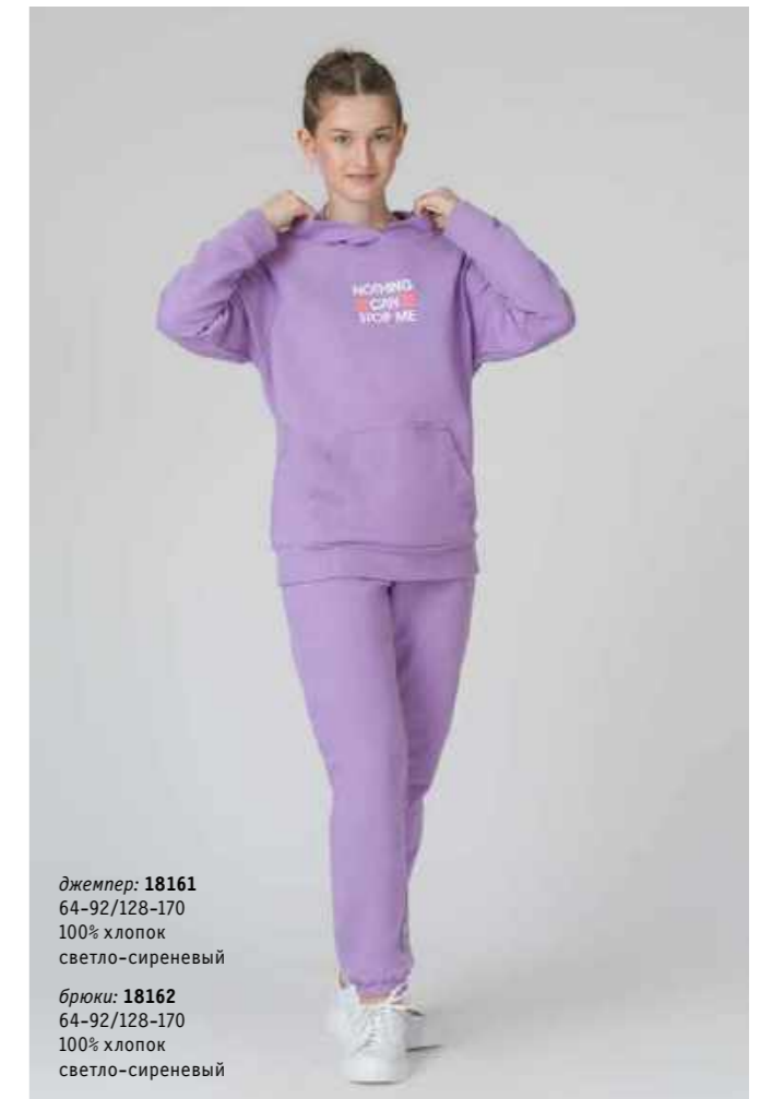
джерсер: 18161 64-92/128-170 100% хлопок светло-сиреневый брюки: 18162 64-92/128-170 100% хлопок светло-сиреневый