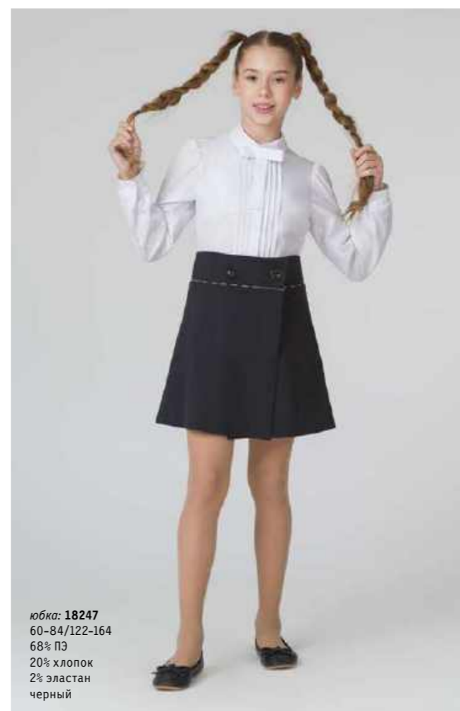
юбка: 18247 60-84/122-164 68% ПЭ 20% хлопок 2% эластан черный