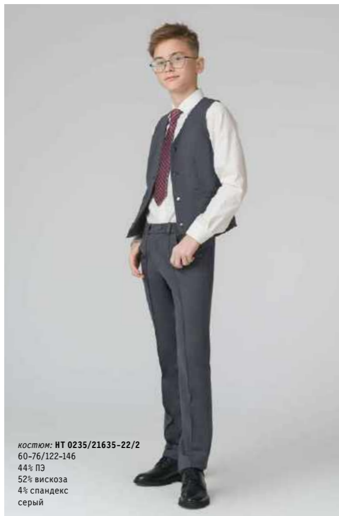
костюм: НТ 0235/21635-22/2 60-76/122-146 44% ПЭ 52% вискоза 4% спандекс серый