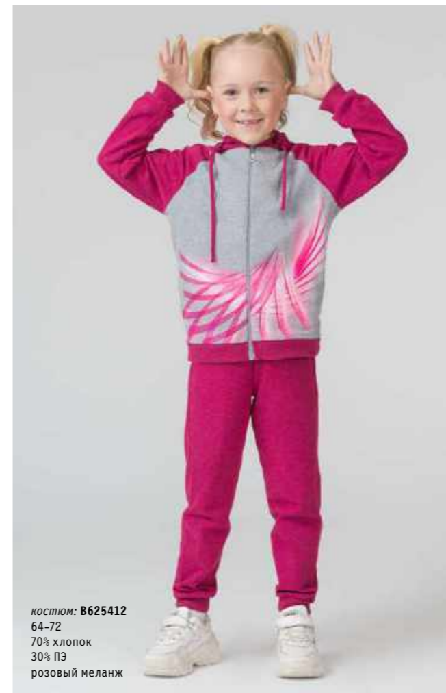
костюм: В625412 64-72 70% хлопок 30% ПЭ розовый меланж