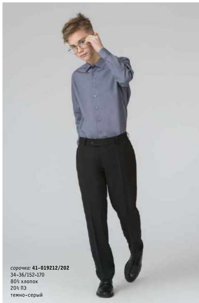
сорочка: 41-019212/202 34-36/152-170 80% хлопок 20% ПЭ темно-серый