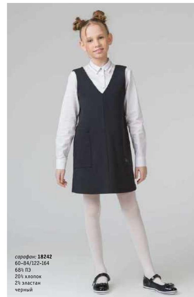
сарафан: 18242 60-84/122-164 68% ПЭ 20% хлопок 2% эластан черный