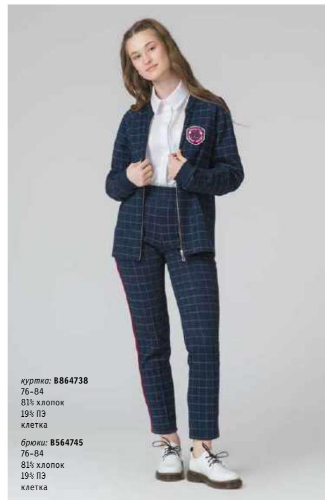
куртка: B864738 76-84 81% хлопок 19% ПЭ клетка