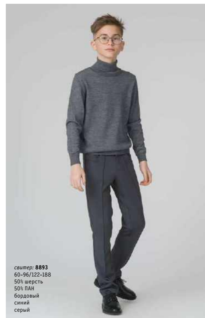
свитер: 8893 60-96/122-188 50% шерсть 50% ПАН бордовый синий серый