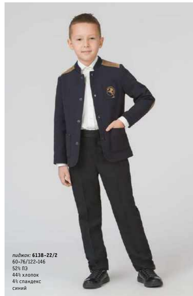
пиджак: 6138-22/2 60-76/122-146 52% ПЭ 44% хлопок 4% спандекс синий