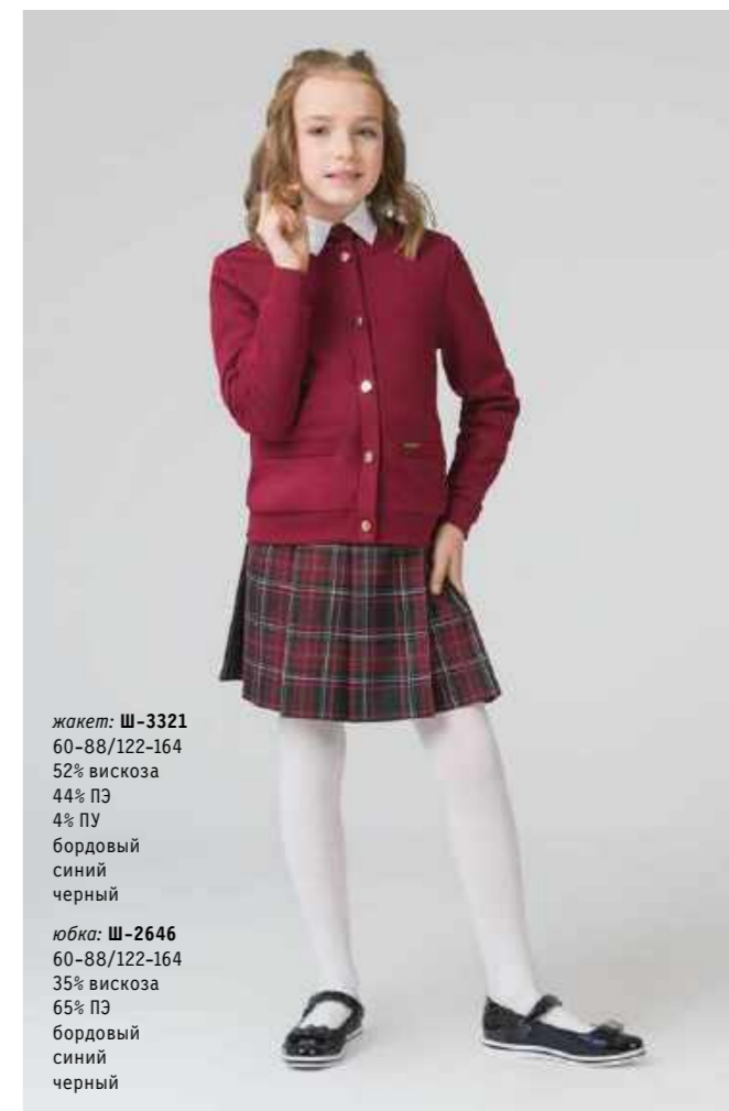
жакет: Ш-3321 60-88/122-164 52% вискоза 44% ПЭ 4% ПУ бордовый синий черный юбка: Ш-2646 60-88/122-164 35% вискоза 65% ПЭ бордовый синий черный