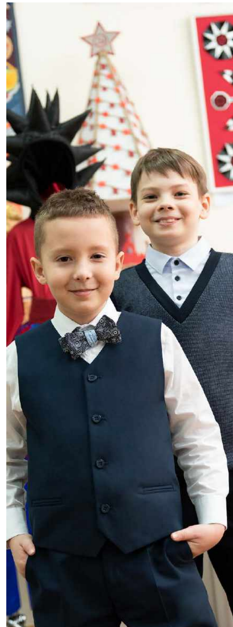
брюки: 20639-22/2 60-76/122-146 35% вискоза 63% ПЭ 2% лайкра синий