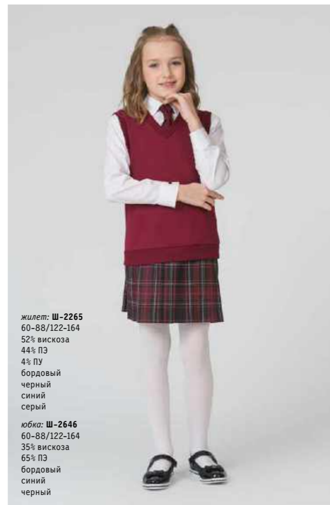
жилет: Ш-2265 60-88/122-164 52% вискоза 44% ПЭ 4% ПУ бордовый черный синий серый юбка: Ш-2646 60-88/122-164 35% вискоза 65% ПЭ бордовый синий черный