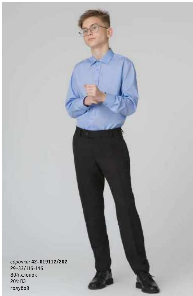
сорочка: 42-019112/202 29-33/116-146 80% хлопок 20% ПЭ голубой