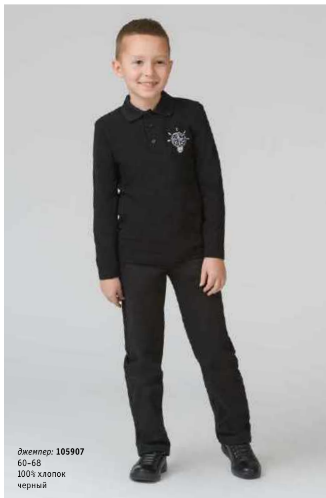
джерпер: 105907 60-68 100% хлопок черный