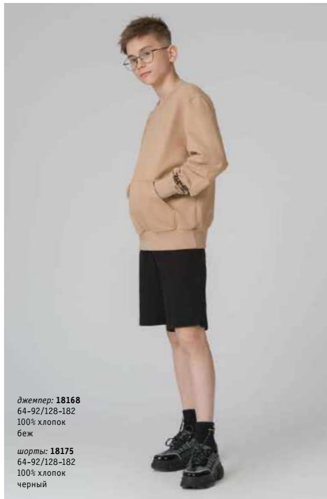
джерсер: 18168 64-92/128-182 100% хлопок беж