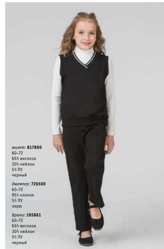
жилет: 817800 60-72 65% вискоза 30% нейлон 5% ПУ черный джерпер: 726500 60-72 95% хлопок 5% ПУ экрю брюки: 105861 60-72 65% вискоза 30% нейлон 5% ПУ черный