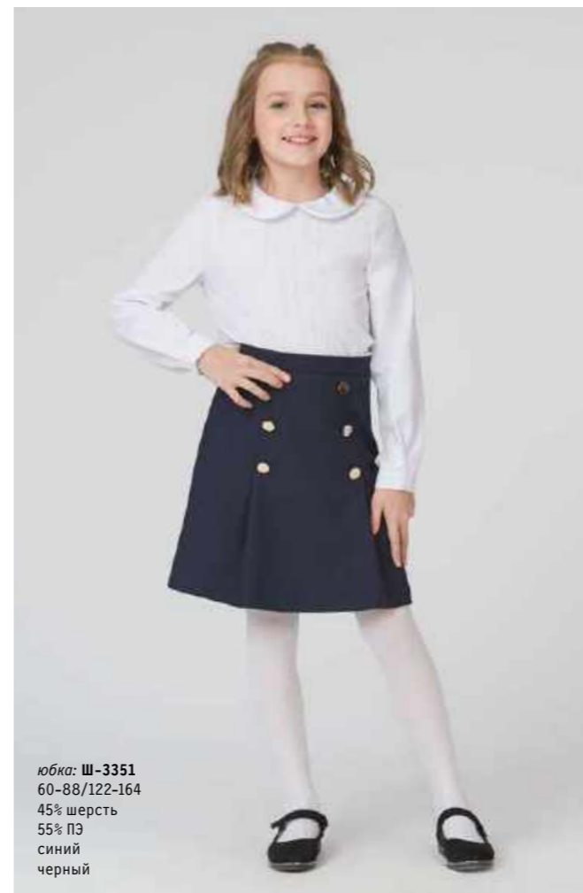
юбка: Ш-3351 60-88/122-164 45% шерсть 55% ПЭ синий черный