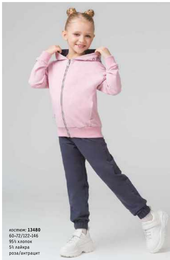
костюм: 13480 60-72/122-146 95% хлопок 5% лайкра роза/антрацит