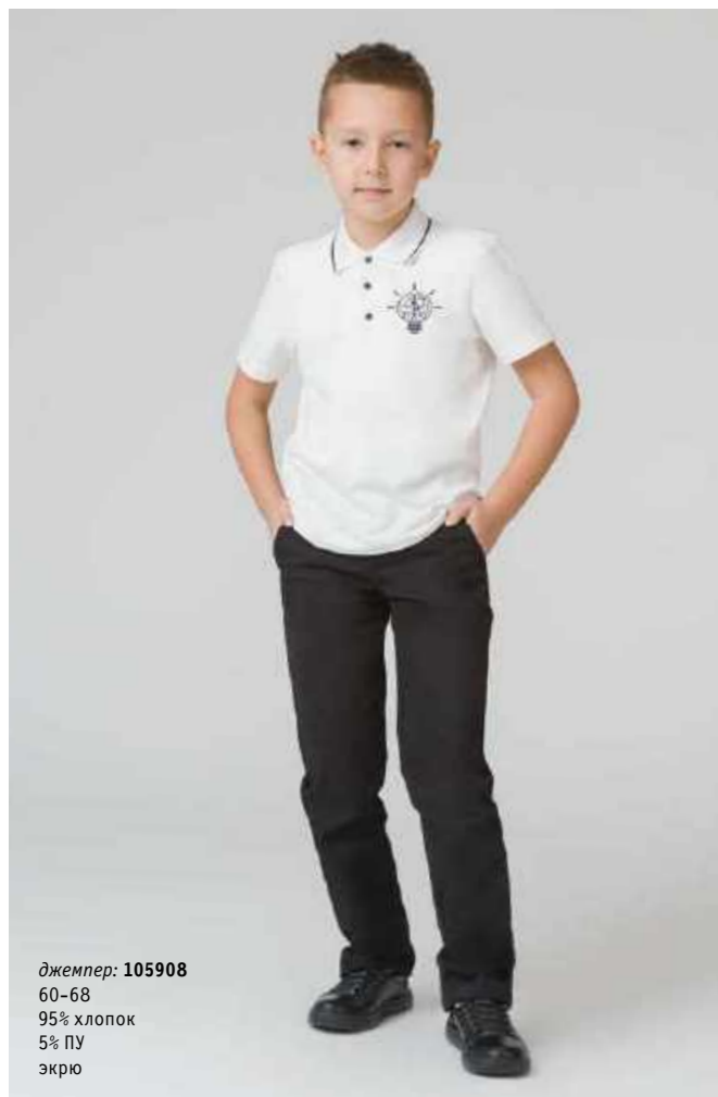
джерпер: 105908 60-68 95% хлопок 5% ПУ экрю