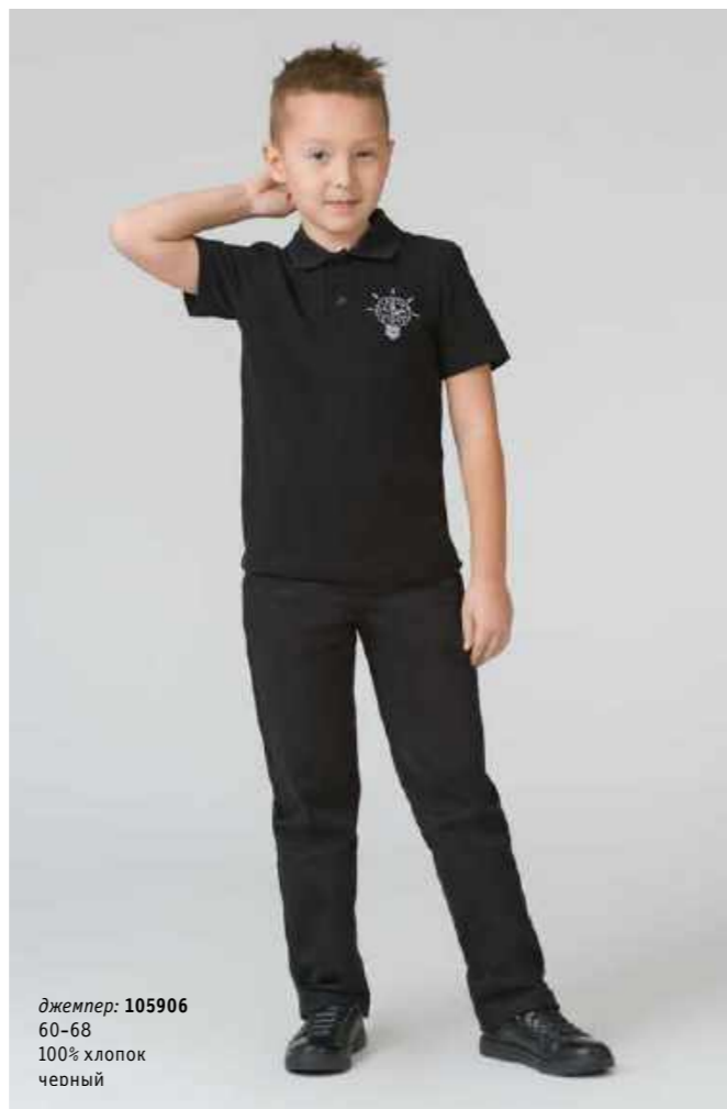
джерпер: 105906 60-68 100% хлопок черный