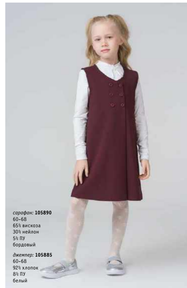
сарафан: 105890 60-68 65% вискоза 30% нейлон 5% ПУ бордовый