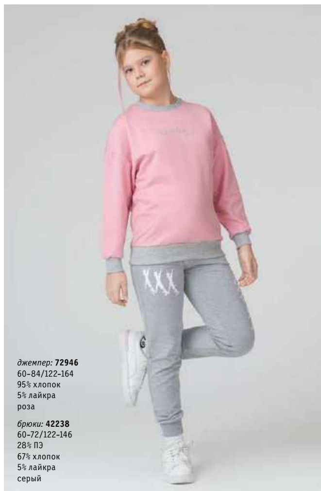
джерсер: 72946 60-84/122-164 95% хлопок 5% лайкра роза брюки: 42238 60-72/122-146 28% ПЭ 67% хлопок 5% лайкра серый